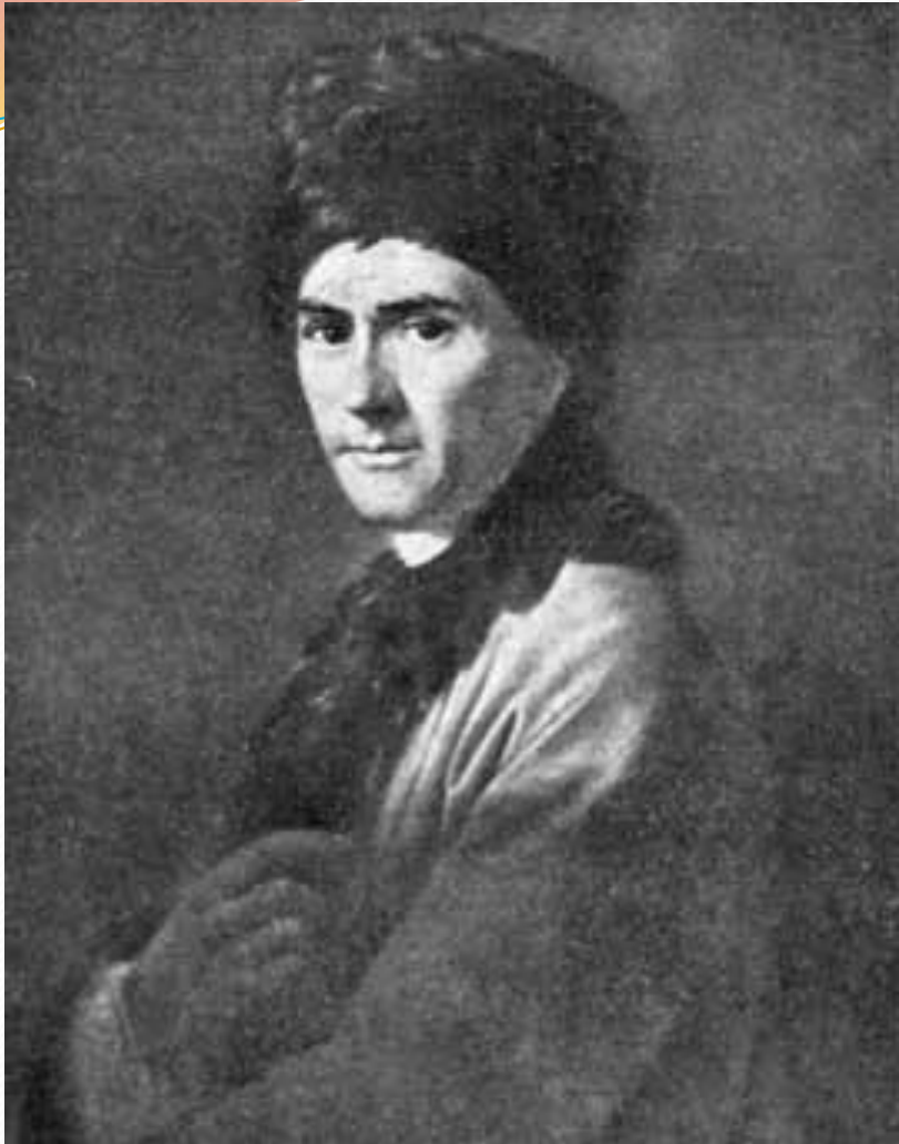
Жан Жак Руссо