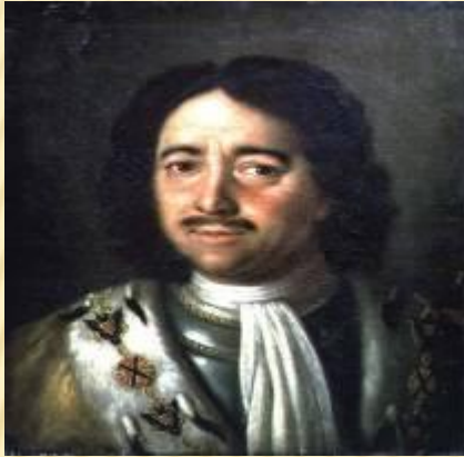
1 Пётр I