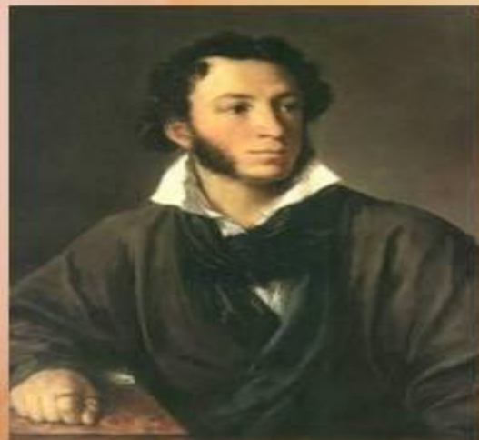
А.Пушкин (в определённый период твор-ва)