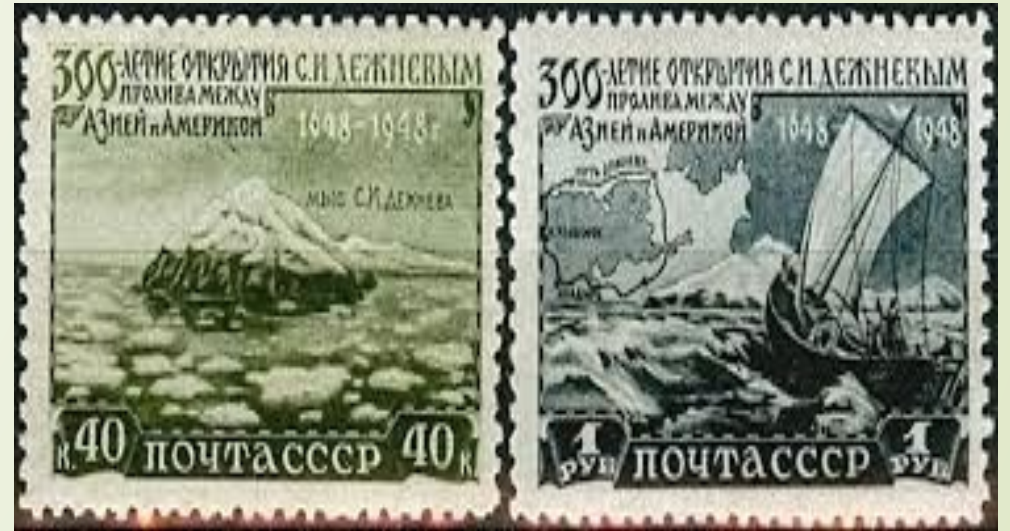
ПОЧТОВЫЕ МАРКИ СССР 1949