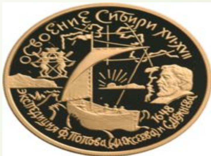
Памятная монета экспедиция Ф.Попова и С.Дежнева