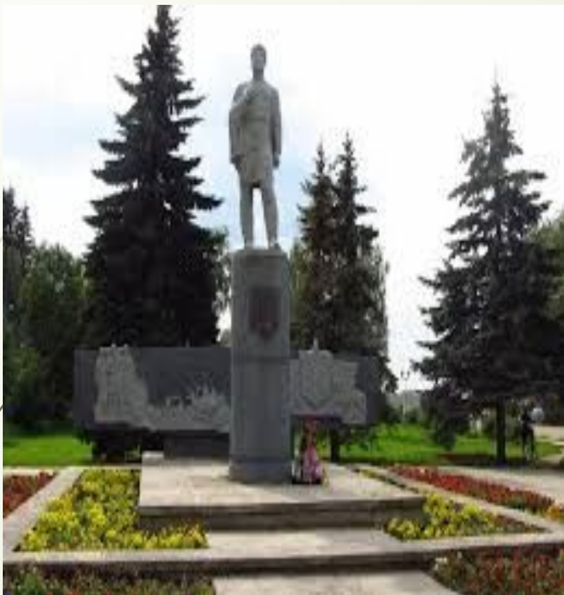
Памятник в центре Устюга 1971