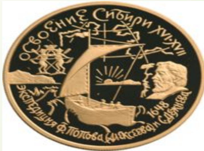
Памятная монета экспедиция Ф.Попова и С.Дежнева