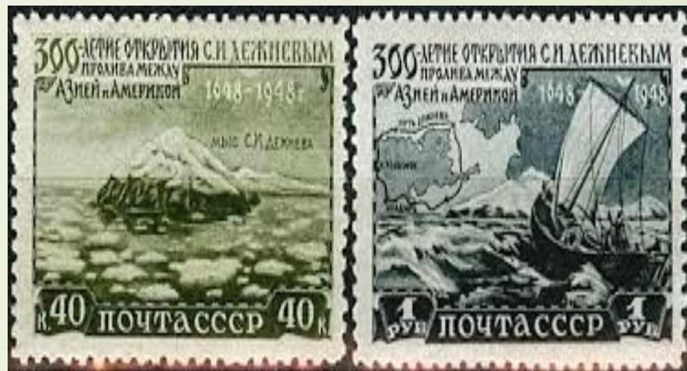
ПОЧТОВЫЕ МАРКИ СССР 1949