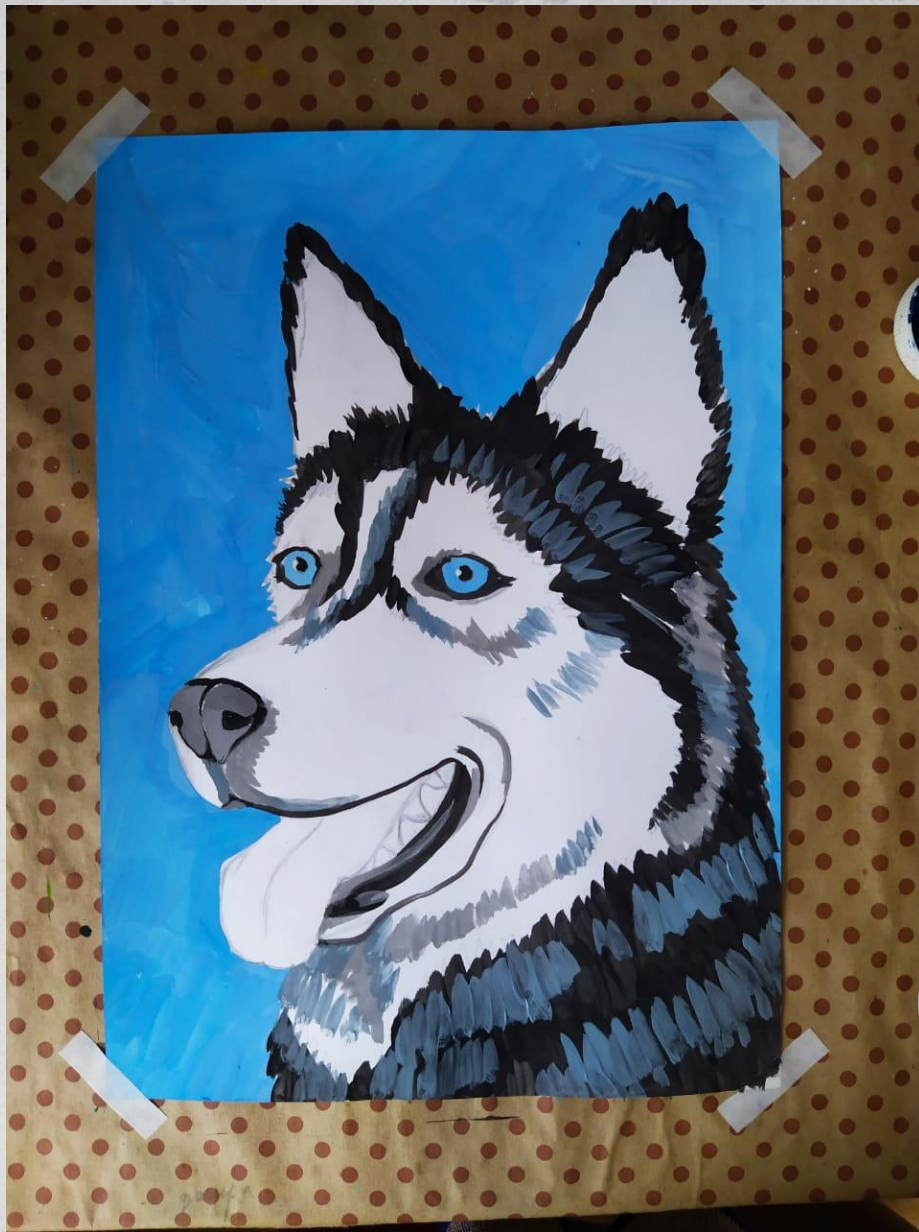
Черный + белый + капля синего