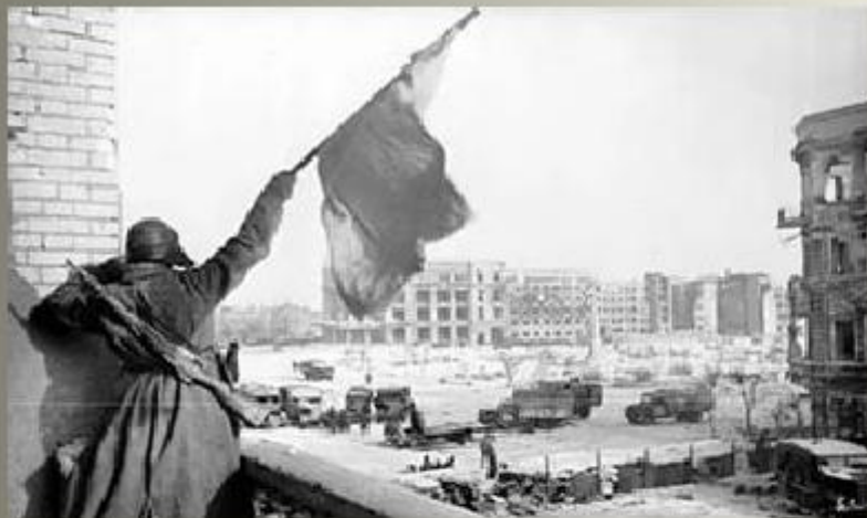
Фотохроника Сталинградской битвы. Интернет ресурсы:

https://yandex.ru/image/s/search?text=Сталинградская%20битва%20картинки&stype=image&lr=36&noreask=1&parent-reqid=1490613227236321-3364755699214598080432223-myt1-0797&source=wiz