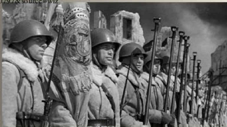
Фотохроника Сталинградской битвы.