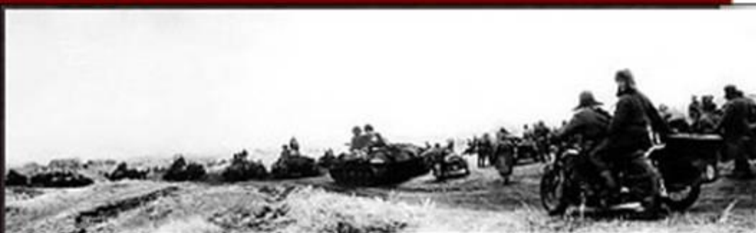
Под Сталинградом. 1942 г. Фотография.