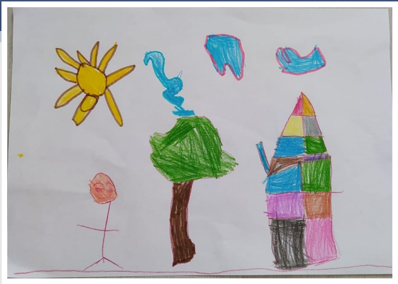
Настя, 4 года