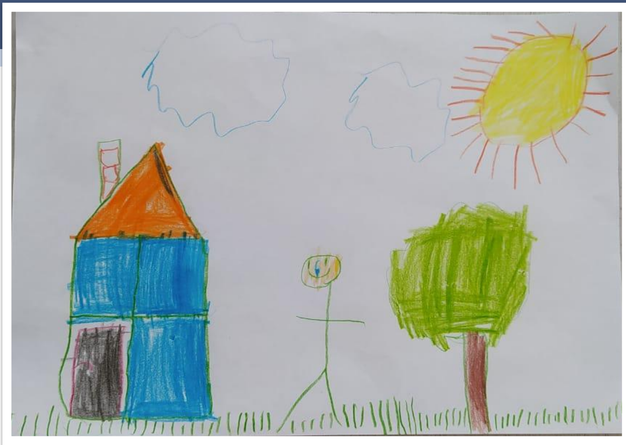
Паша, 6 лет