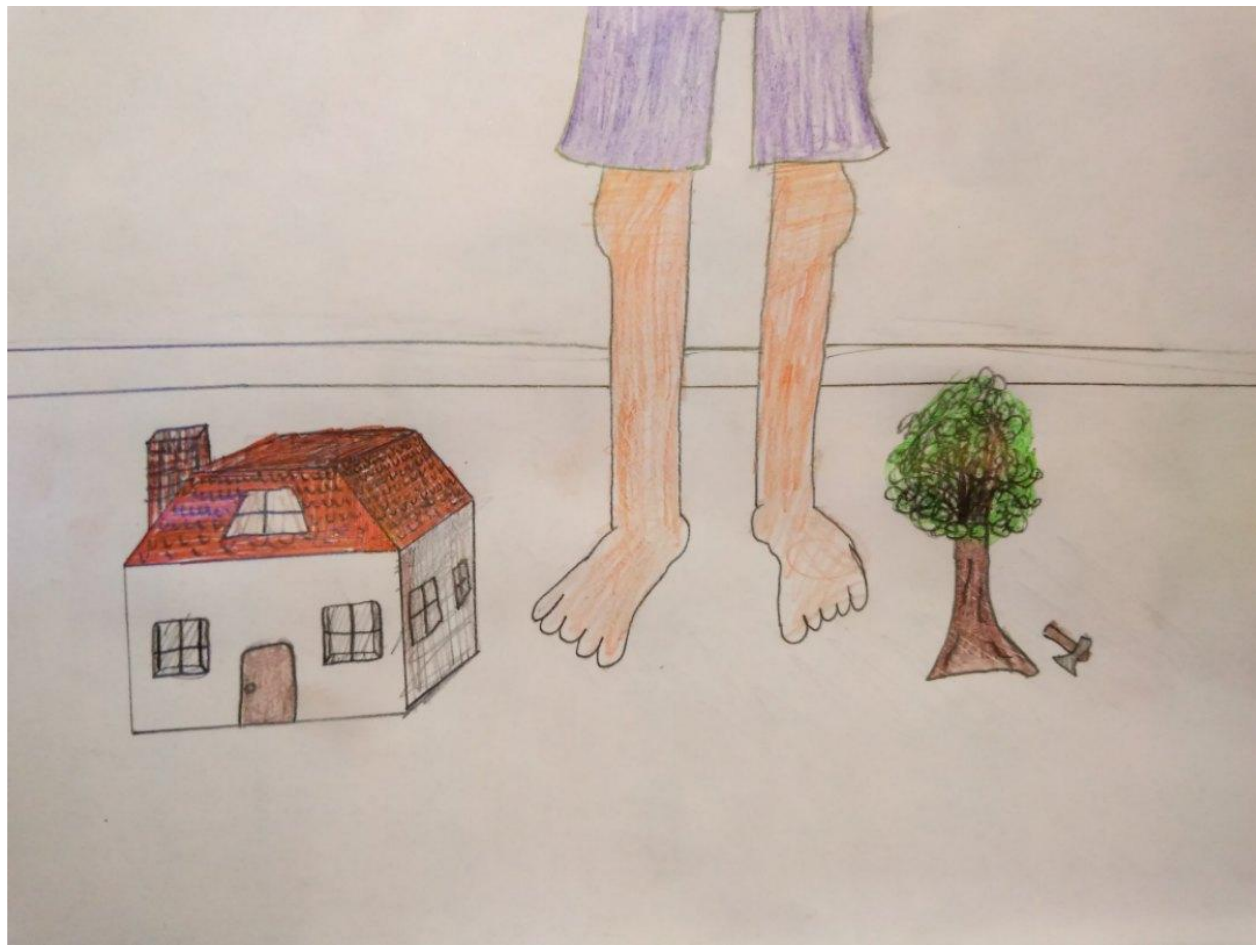
Назар, 16 лет