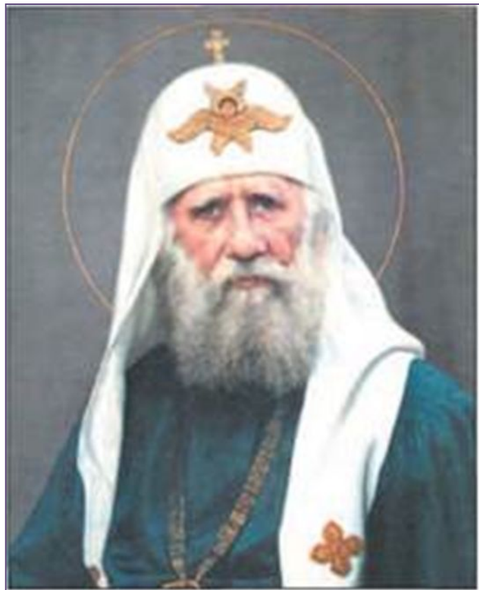
Патриарх Тихон. Худ. В. Шилов

Август 1917 года - Синод упразднён – Министерство исповеданий.