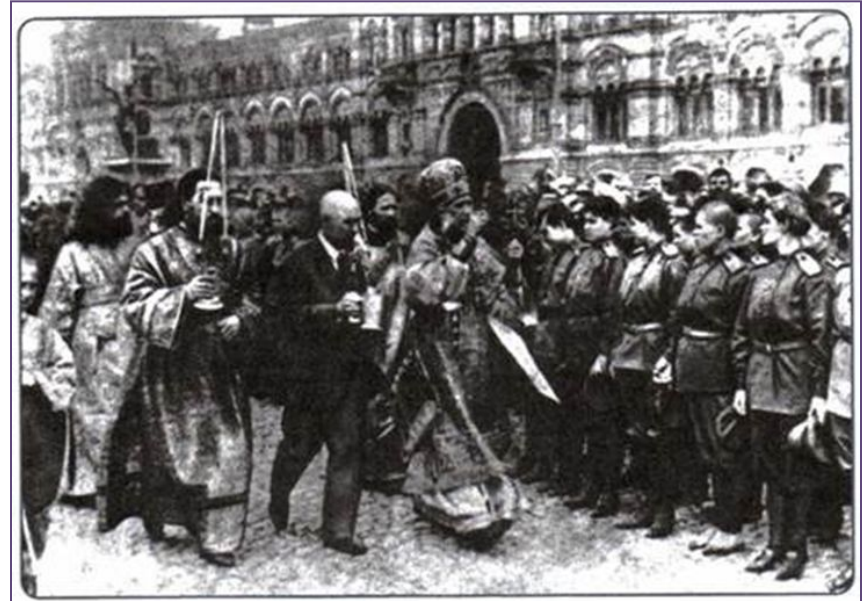
Митрополит Московский и Коломенский Тихон благословляет солдат перед отправкой на фронт. Лето 1917 г.

Работая с текстом параграфа (стр.36-37), определите, как изменилось положение РПЦ после Февральской революции 1917 г.?