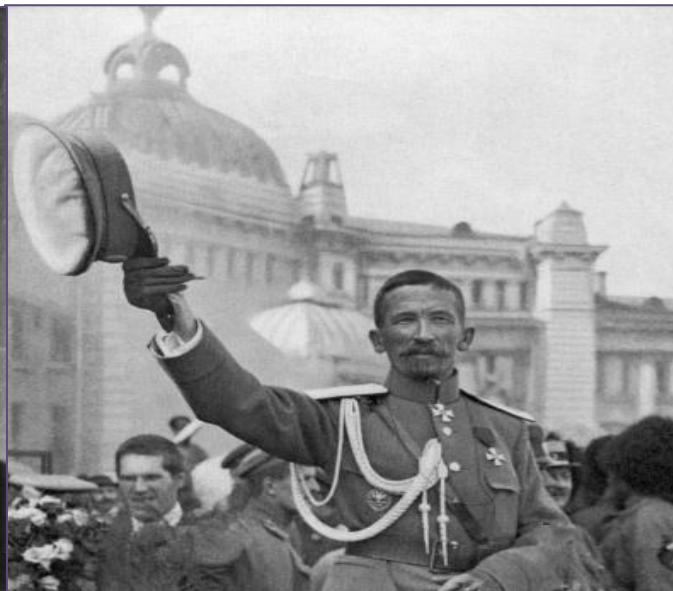
Встреча на вокзале в Москве Л.Г. Корнилова

Стремясь сплотить поддерживающие его силы и предотвратить Гражданскую войну, А.Ф. Керенский выступил инициатором созыва в Москве 12 августа Государственного совещания . В нем приняли участие представители армии, крупнейших политических и общественных организации, депутаты всех Государственных дум. Большевики отказались участвовать в совещании.