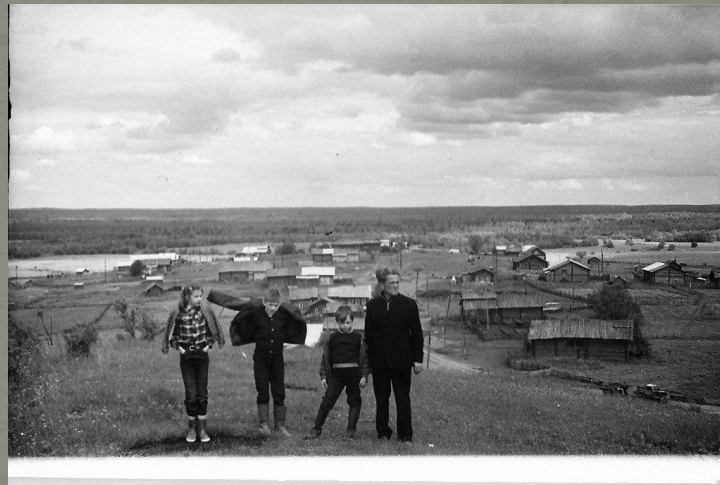
Деревня Коробицыно 70-80 годы