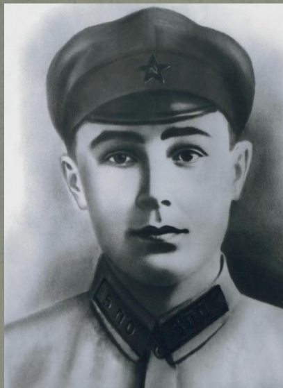
Андрей Иванович Коробицын герой - пограничник

Мы живем на исторической земле, на земле, которая родила и воспитала 2 героев. Маленькая деревня Тотемского уезда, Куракинской волости - деревня Куракино. Где и по сегодняшний день живут трудолюбивые, добрые люди. Мы гордимся, что можем прикоснуться к этой земле, услышать этих людей. Мы можем брать пример и равняться на героев!