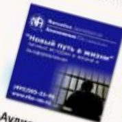
Аудио-диск с личными историями для мужских МЛС «Новый путь в жизни» Формат CD, тр3