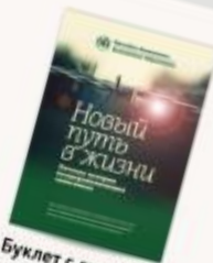
Буклет с личными историями для мужских МЛС «Новый путь в жизни» Формат А5, 35 страниц