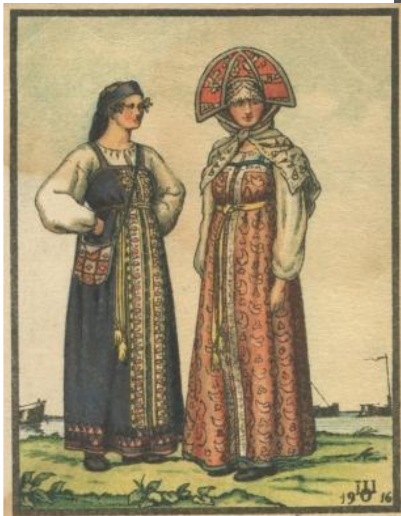
Калужская Народная женская одежда. ВЕЛИКОРОССЫ Шулььской и Калужской губерний.