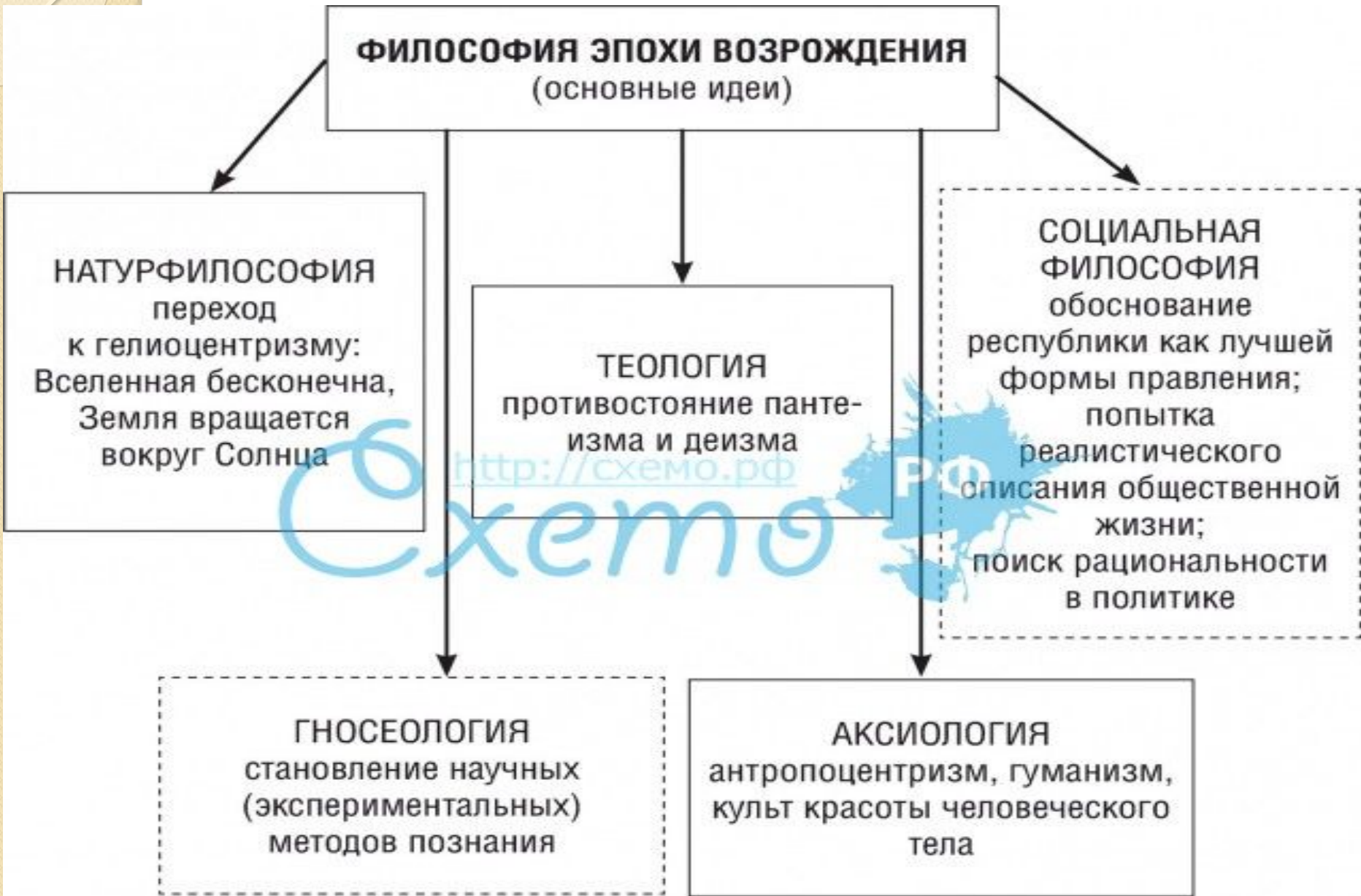
Рисунок 6.1. Разделы философии эпохи Возрождения: основные идеи. Формирующиеся разделы выделены пунктиром