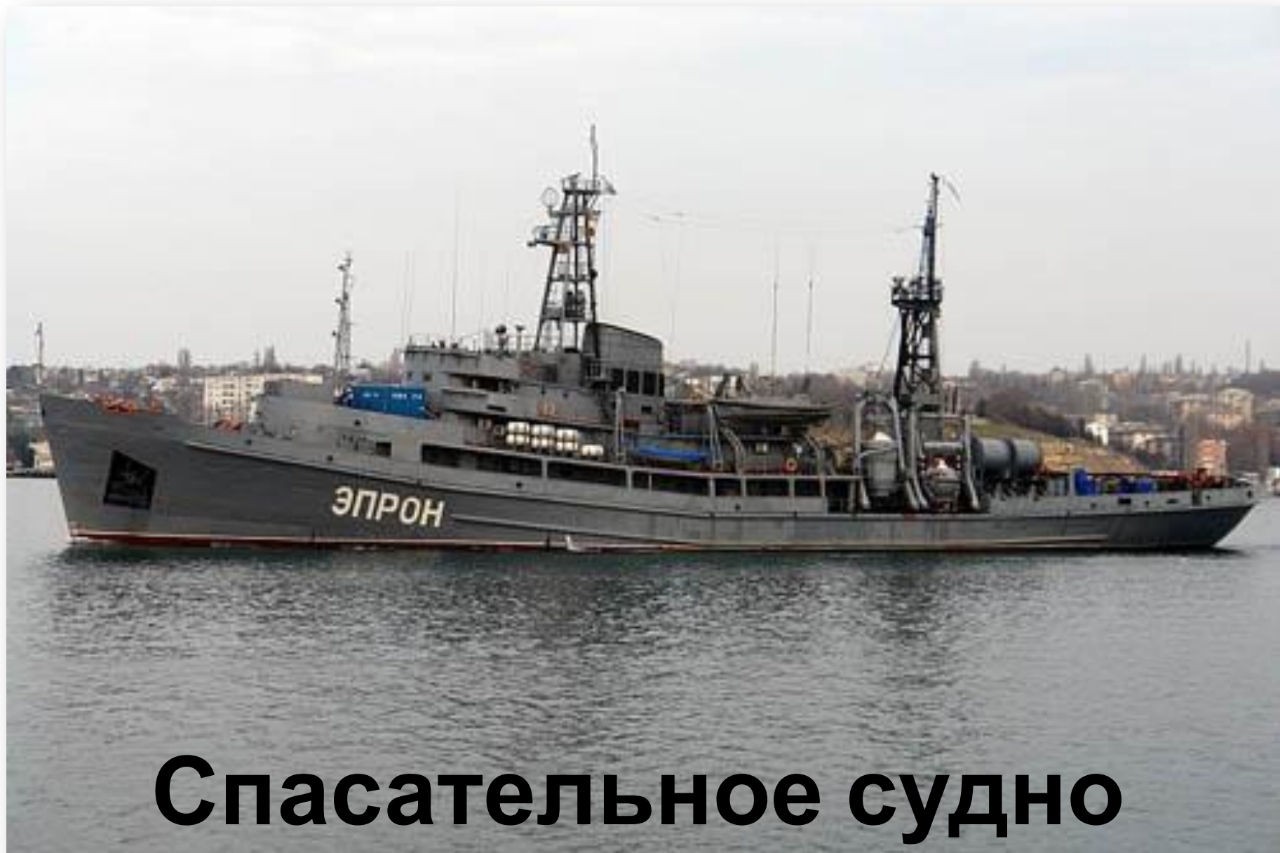
Спасательное судно «ЭПРОН»