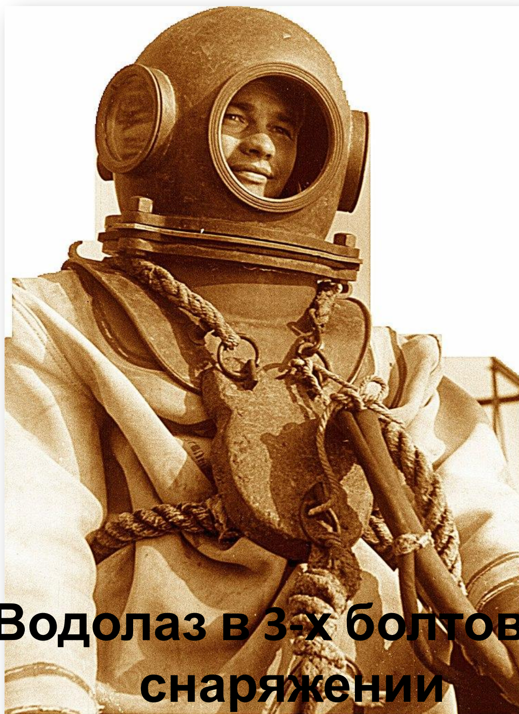
Водолаз в 3-х болтовом снаряжении