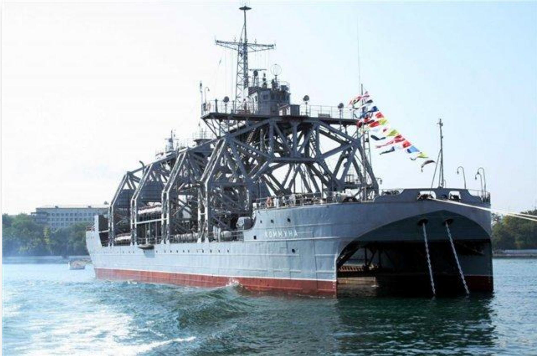
Спасательное судно-катамаран «Коммуна»