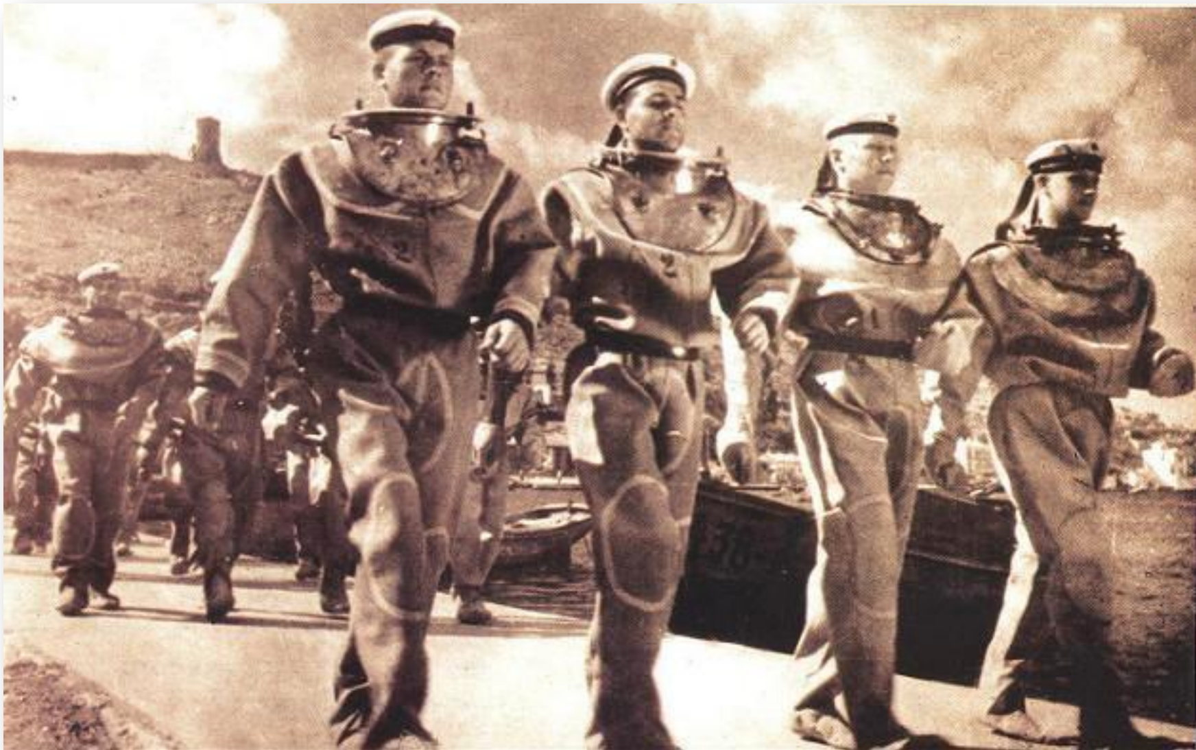
Балаклава. Водолазы на параде