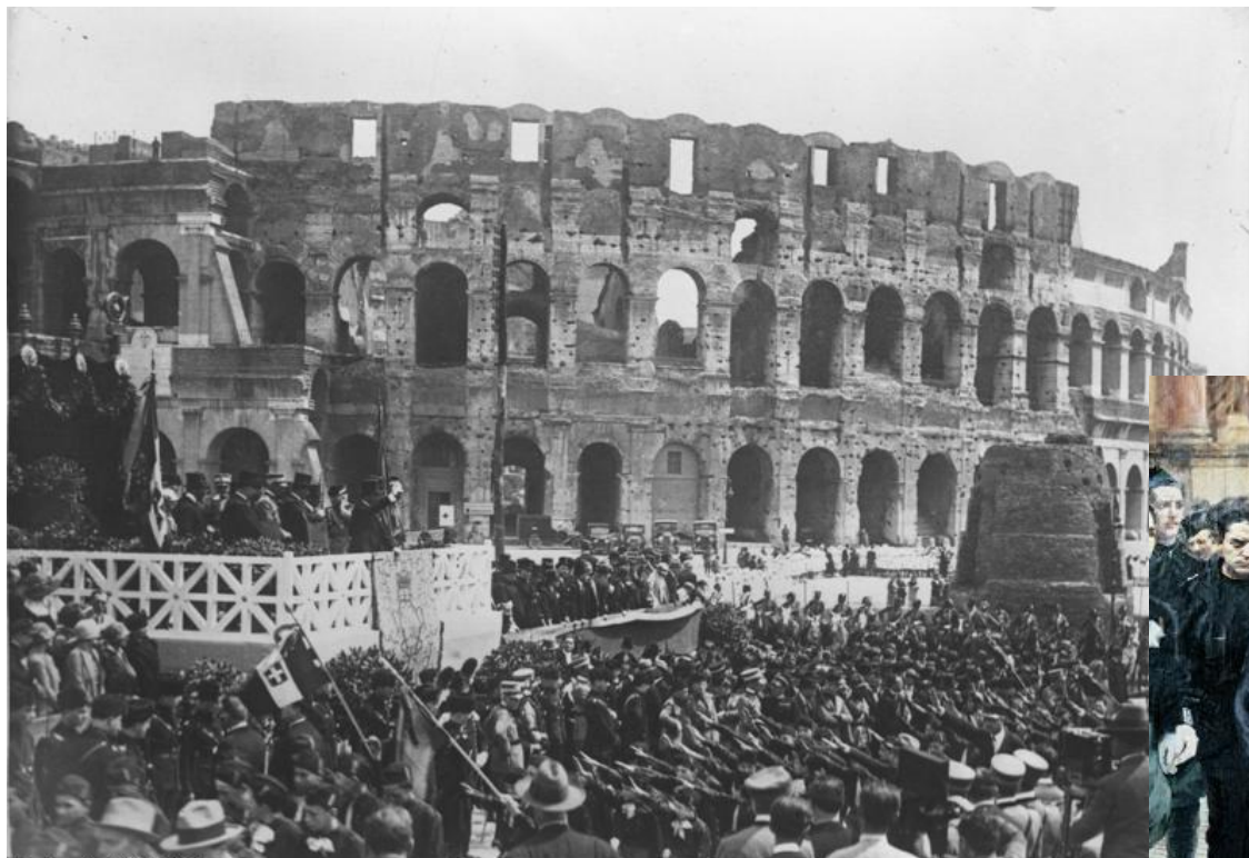
Оборона Рима октябрь 1922г