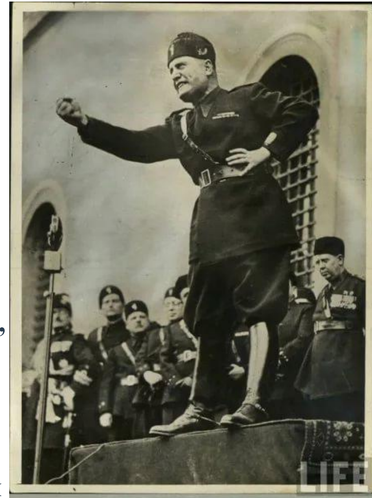
Муссолини на выступлении перед народом