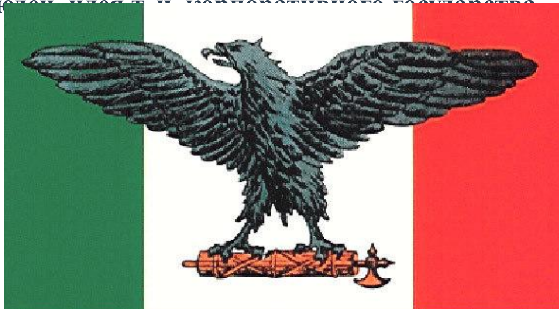
Флаг Италии во времена фашистской диктатуры

Термин «Фашизм» имеет двойное происхождение. С итальянского fascio переводится как «лига». С латинского – «пучок». Он выступал как символ древнеримской администрации. Лидер итальянского фашизма – премьер-министр страны – сделал фасции отличительным знаком своей партии. Начиная свою деятельность, он стремился к восстановлению Римской империи. Фасция была принята в 1919 г. Считается, что с этого момента зародился фашизм — политическая идеология диктаторского типа, представляющая государство как высшую ценность, а народ (нацию) — объединённой корпорацией людей, чья цель — корпоративное государство.