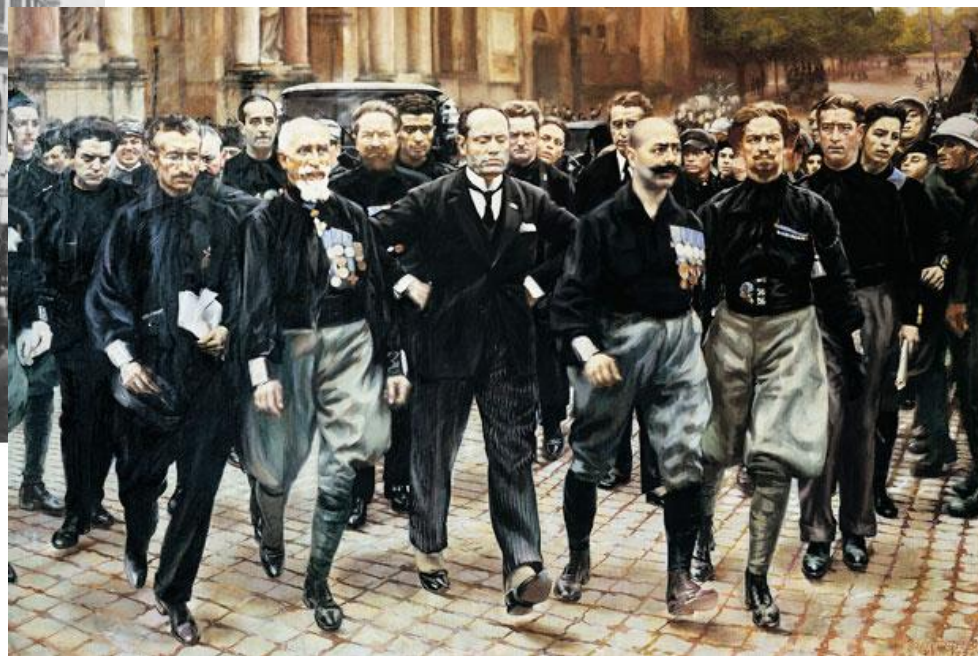
Муссолини в марше похода на Рим