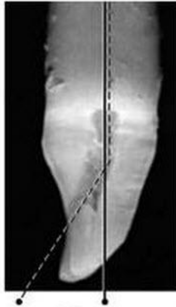
Некорректное направление Доступ по прямой

доступ с окклюзионной поверхности Нельзя с лингвальной !!!!