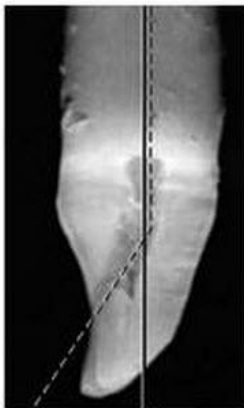
Некорректное направление Доступ по прямой

доступ с окклюзионной поверхности Нельзя с лингвальной !!!!