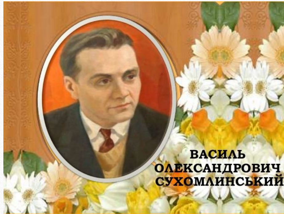
ВАСИЛЬ ОЛЕКСАНДРОВИЧ СУХОМЛИНСЬКИЙ

Найважливіше і найважче для людини - завжди, у будь-яких обставин залишатися людиною