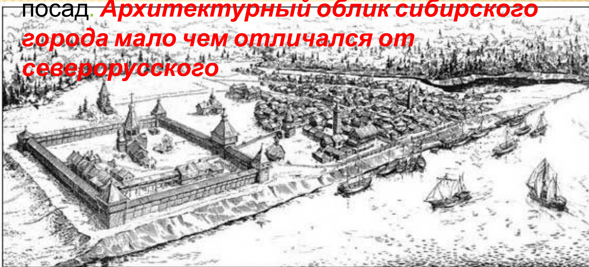
Град Мангазея. Реконструкция.

посад. Архитектурный облик сибирского города мало чем отличался от северорусского