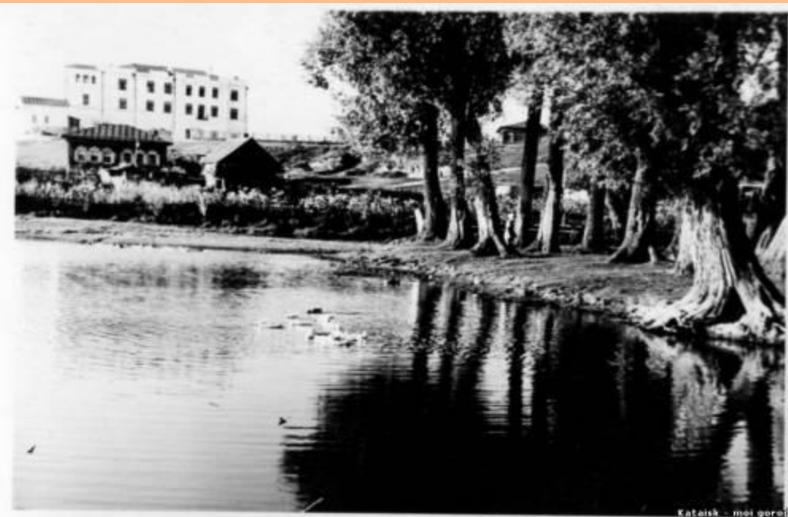
1954 год Восемилетняя школа №2, вид от озерка под милицейской горой.