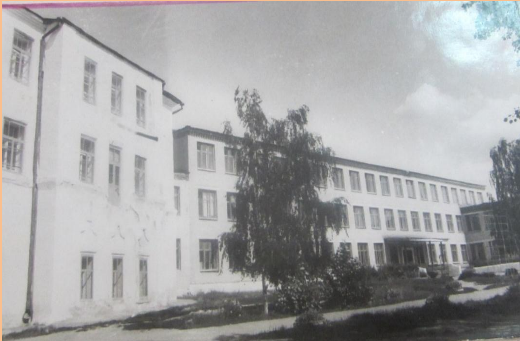
ШКОЛА С НОВЫМ ЗДАНИЕМ 1978 год