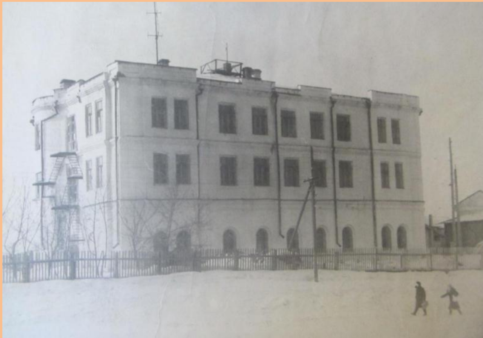
Старое здание школы 1966 год