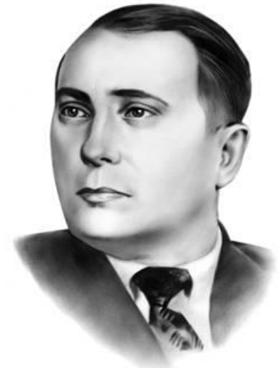
Володимир Сосюра (1898—1965)