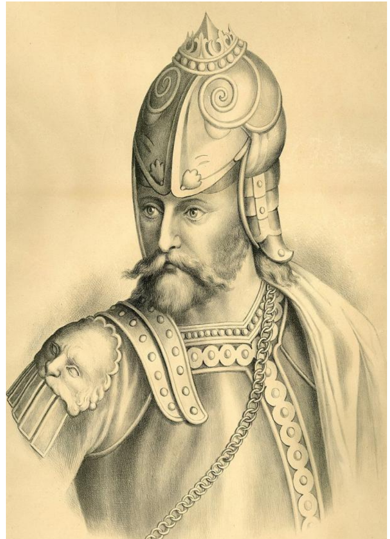
Литовский князь Гедимин (1316-1341 гг)