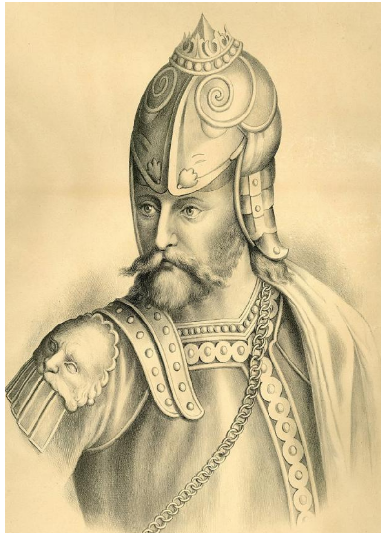
Литовский князь Гедимин (1316-1341 гг)