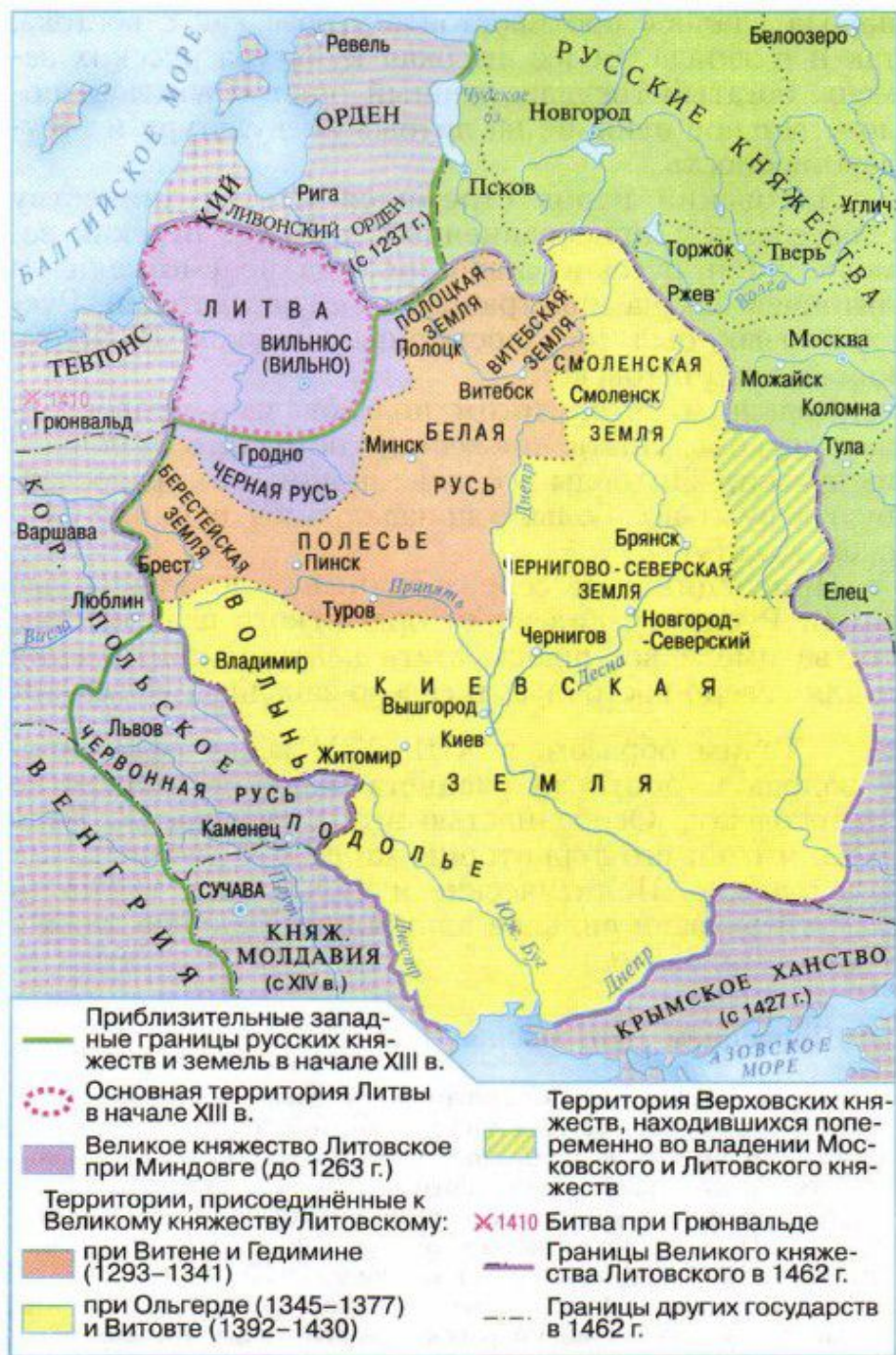
Великое княжество Литовское в XIII–XV веках