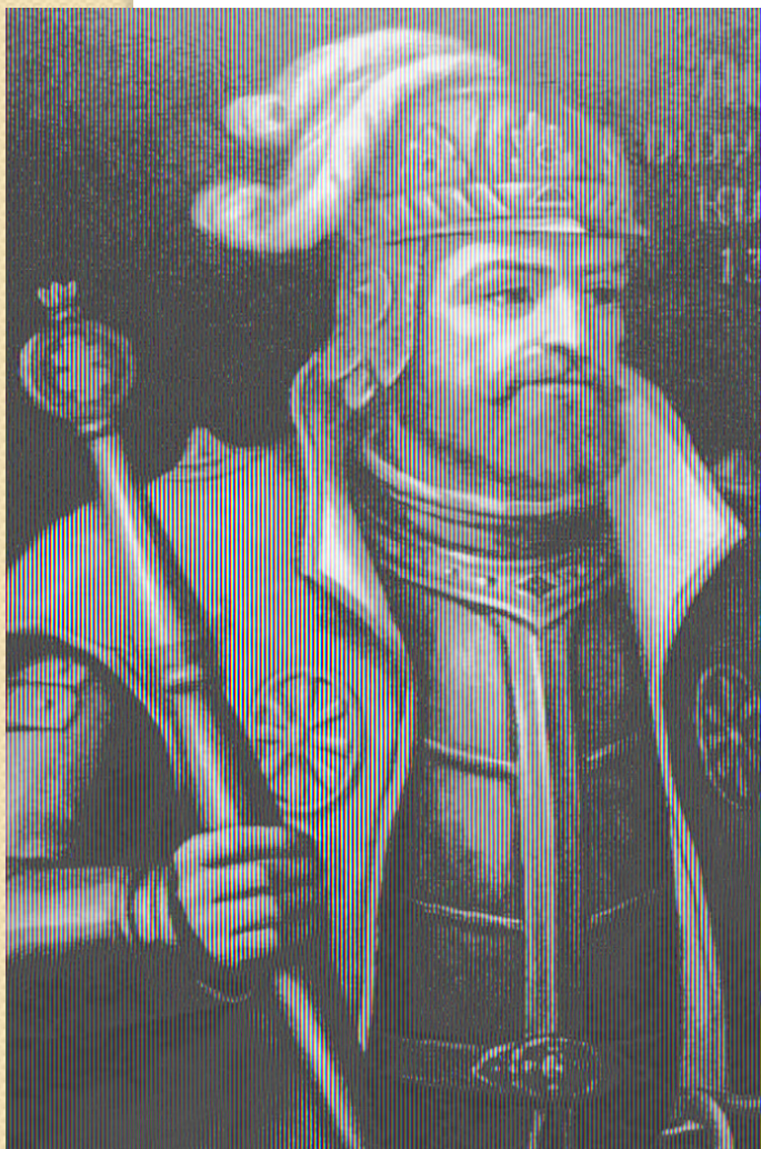
Великий князь Ольгерд (1345-1377 гг.)