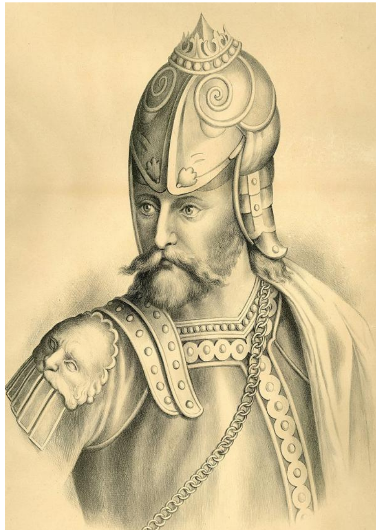
Литовский князь Гедимин (1316-1341 гг)