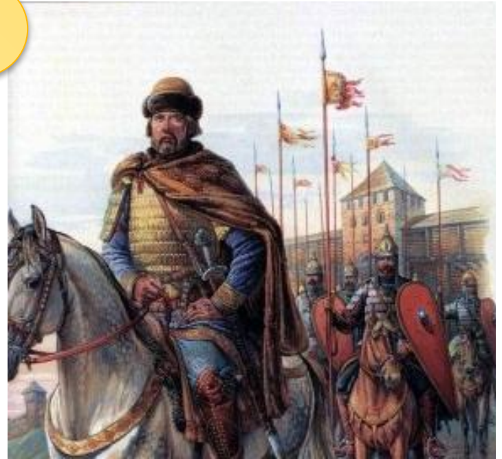
Борис Александрович Тверской (1425-1461)