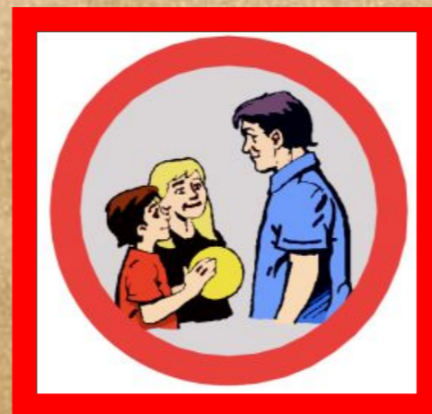
ЖИЗНЬ В СЕМЬЕ