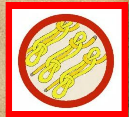
РАБОТА С ВЕРЕВКОЙ