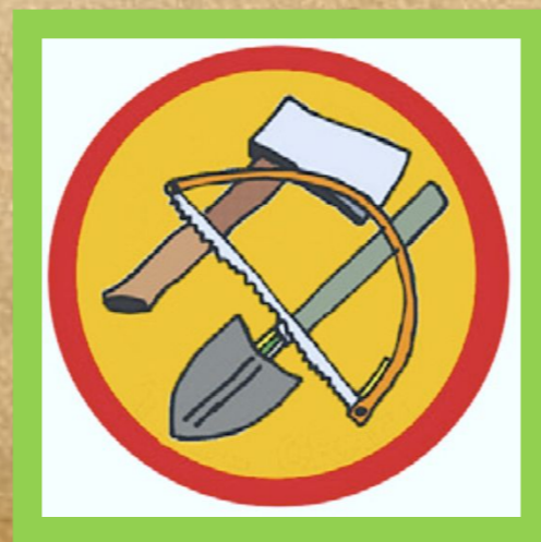
РАБОТА С ИНСТРУМЕНТАМИ