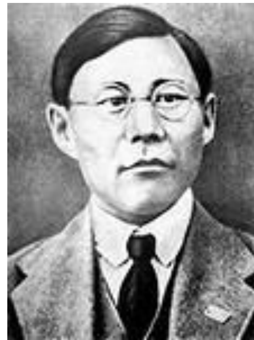
П. А. Ойунский