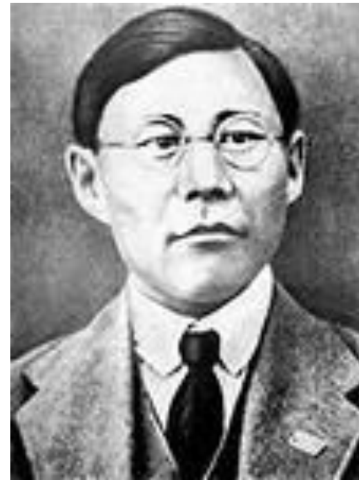
П. А. Ойунский