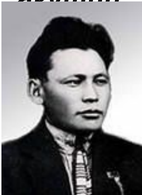
М. К. Аммосов