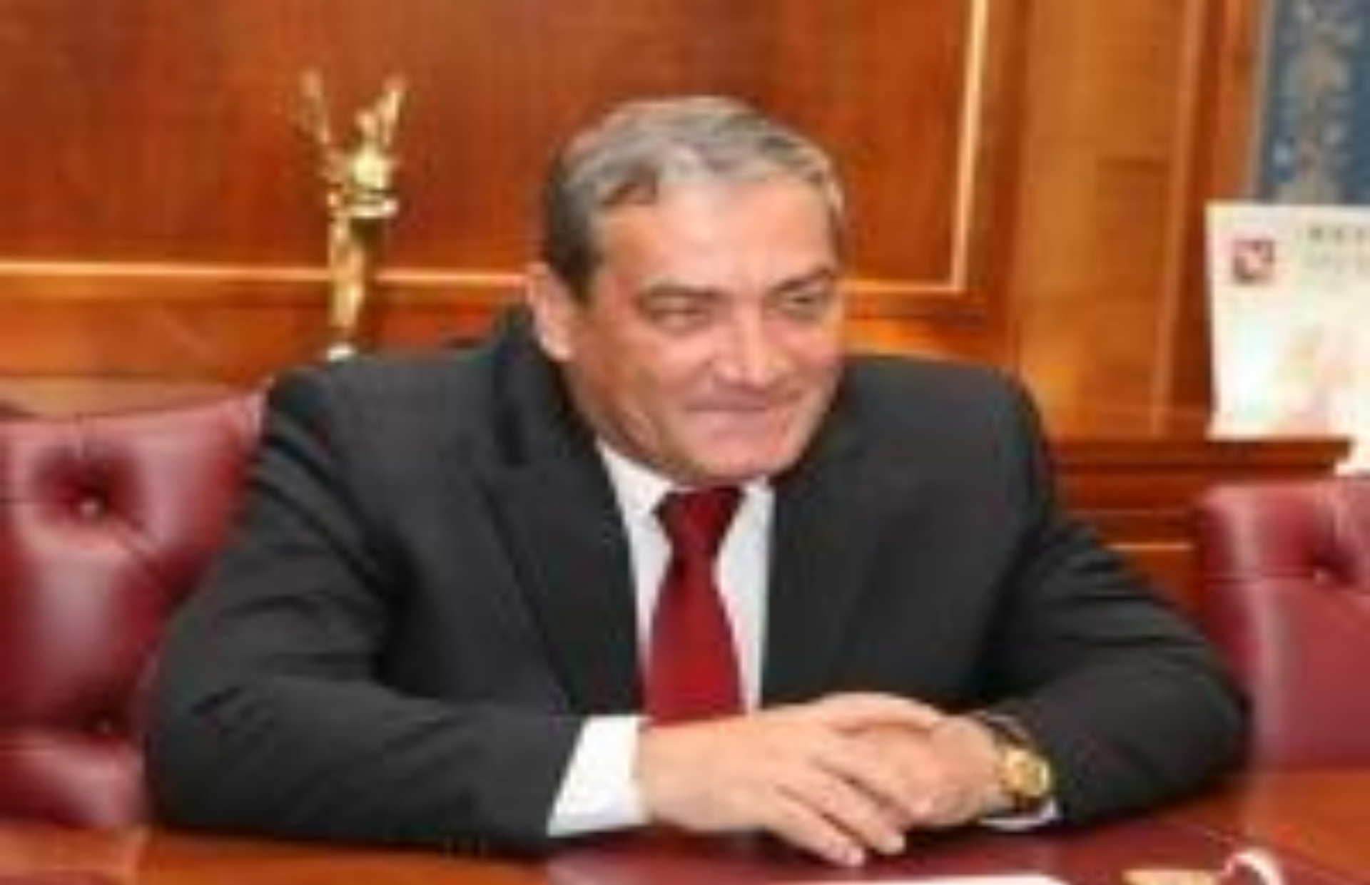
Вячеслав Анато́льевич ШТЫРОВ