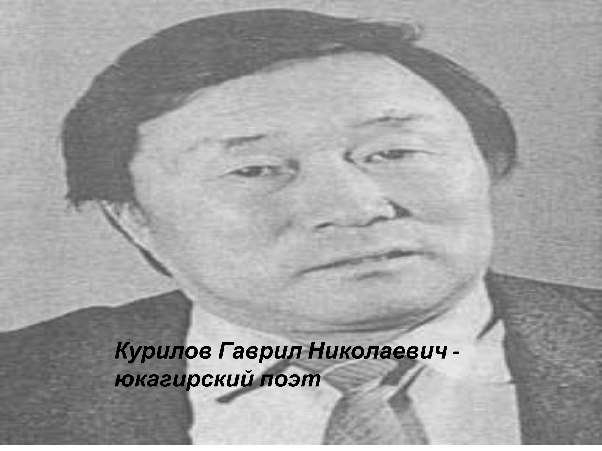
Курилов Гаврил Николаевич - юкагирский поэт