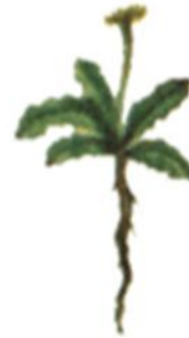
выращен в горах