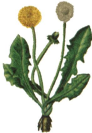
выращен на равнине

Изменчивость одуванчика, выращенного из одного корня