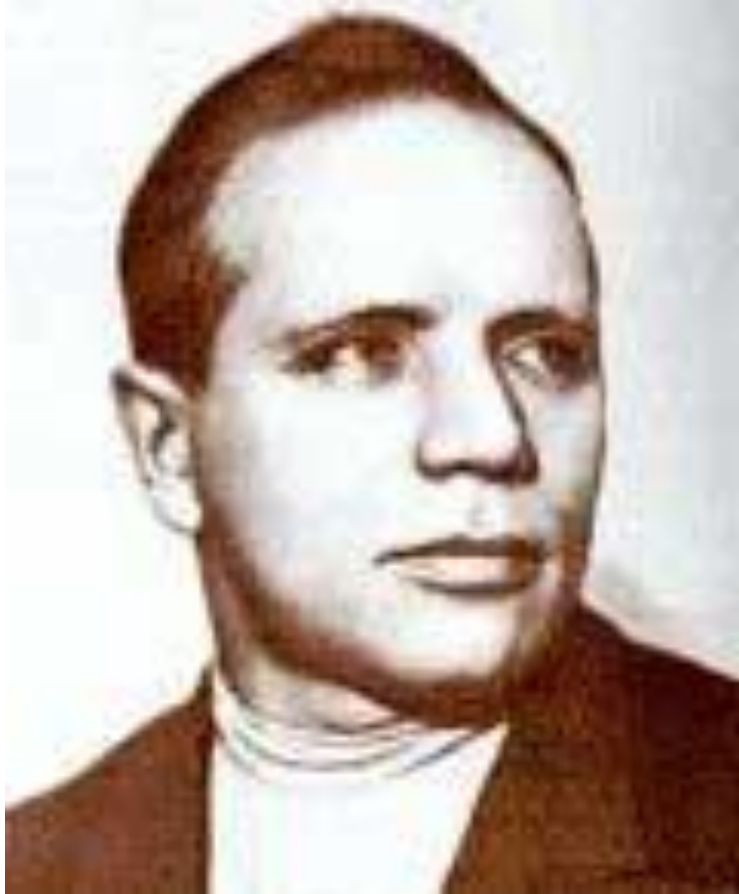
Александр Прокофьев (1900—1971) русский советский поэт

«Я, как сокол, крылья расправляю И, к высотам ревностью томим, Каждый день горю и не сгораю, Защищённый именем твоим! Соколиной доле нет предела, Я совсем немного хочу: Выше головы чтоб было дела, Остальное всё мне по плечу!»