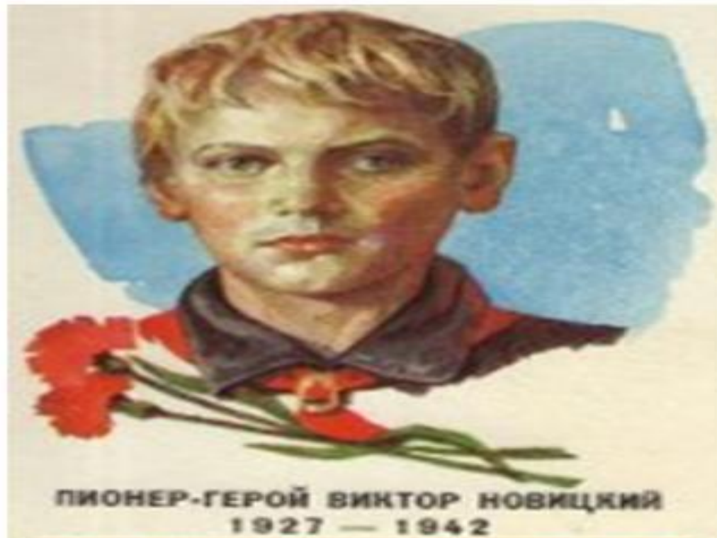
ПИОНЕР-ГЕРОЙ ВИКТОР НОВИЦКИЙ 1927 — 1942

Витя рано осиротел. Родителей он не помнил, воспитывался в семье у дяди. Витя любил свой город и людей, живущих в нем. Фашисты подошли к Новороссийску. Советские воины отстаивали каждый дом, каждую улицу. С ними был и Витя. Вместе с пулеметчиками он засел в башне высокого дома. Отсюда отбивали атаки защитники города. Погибли все, кроме Вити. Немцам удалось ворваться в башню. Мальчика схватили, облили керосином, зажгли и бросили на мостовую.