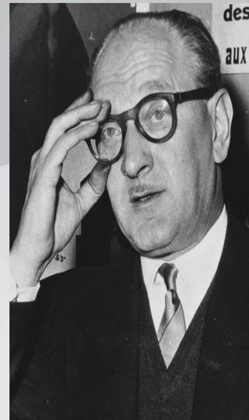
Французский политик Ф. де Ментон