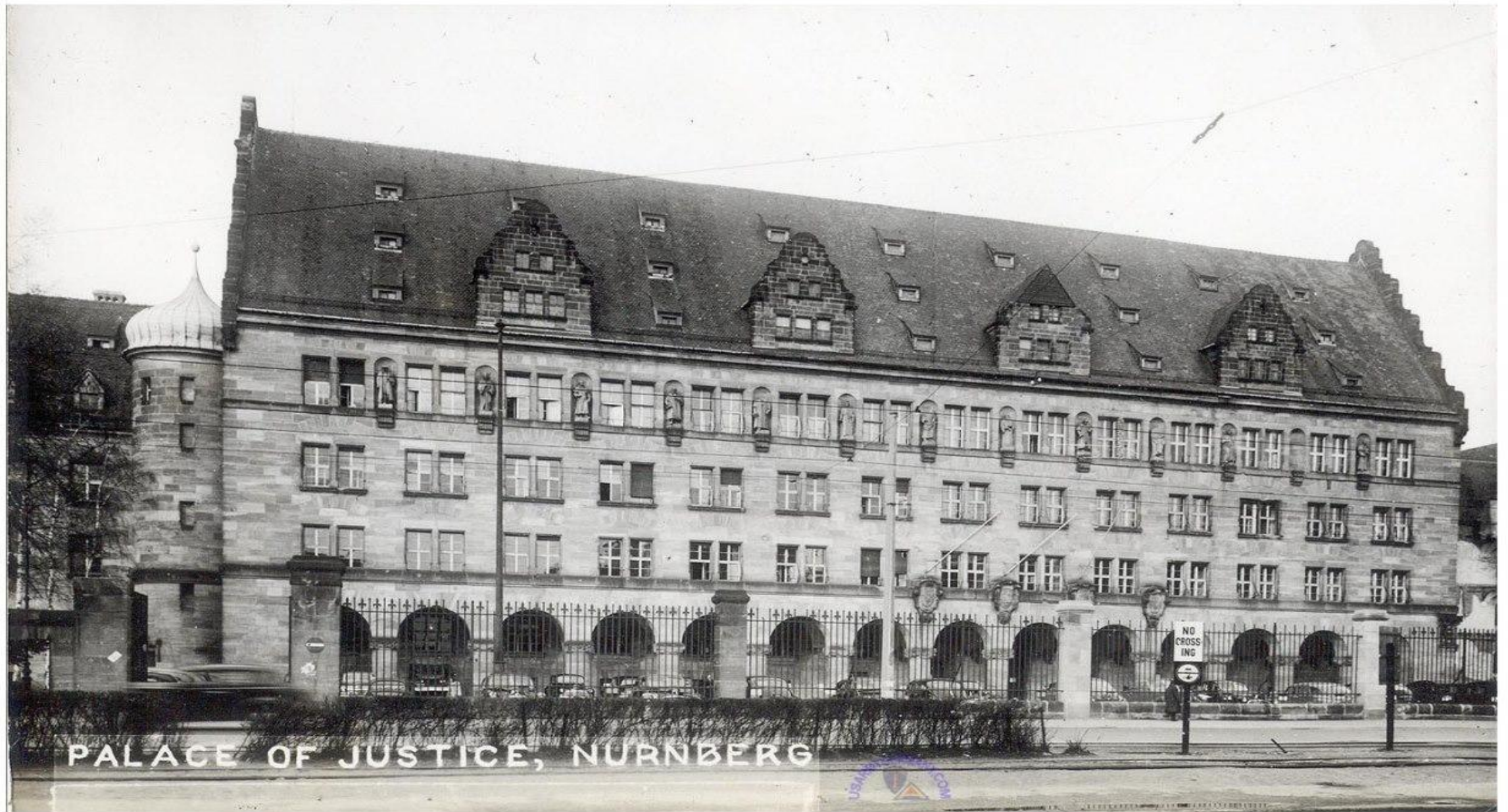
PALACE OF JUSTICE, NURNBERG