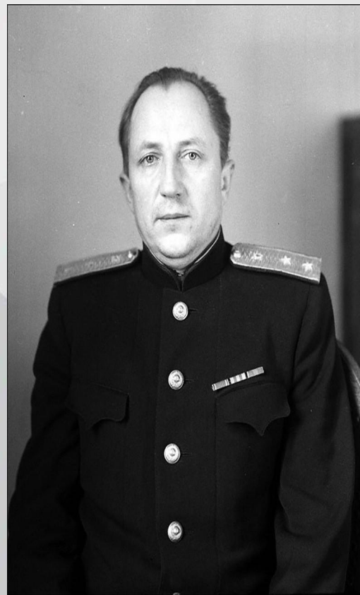
Советский адвокат Р.А. Руденко