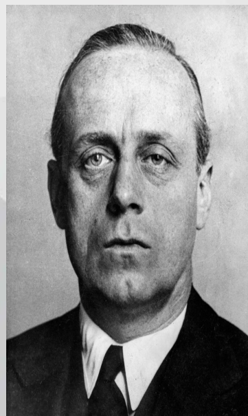
Иоахим фон Риббентроп