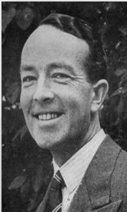
Британский адвокат Х. Шоукросс