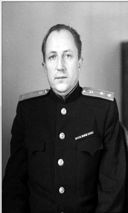
Советский адвокат Р.А. Руденко