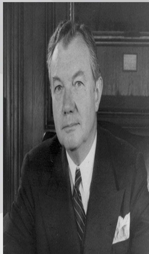
Американский судья Р. Джексон