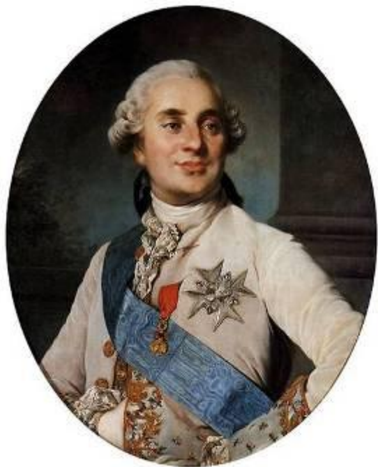
Людовик XVI (1754 – 1793)