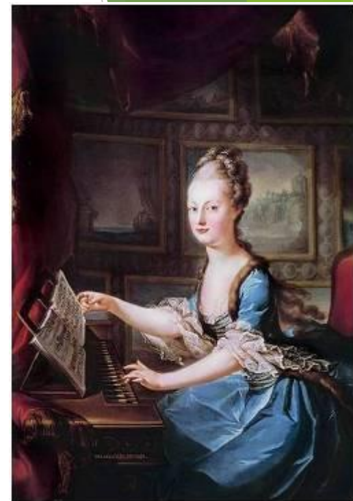
Мария-Антуанетта (1755 – 1793)