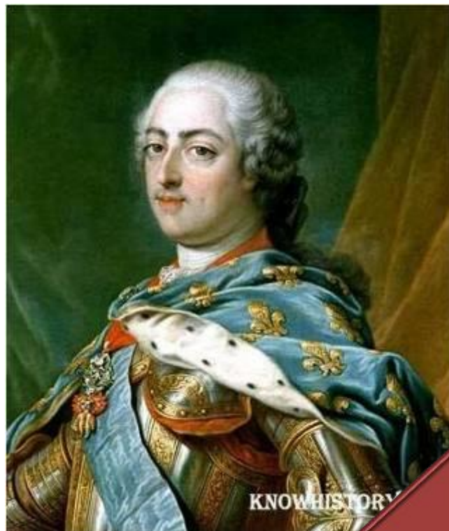
Людвиг XV (1715 – 1774)

«Только в одной моей особе пребывает королевская власть. Весь общественный порядок во всем его объеме исходит от меня, интересы и права нации — все здесь, в моей руке.»