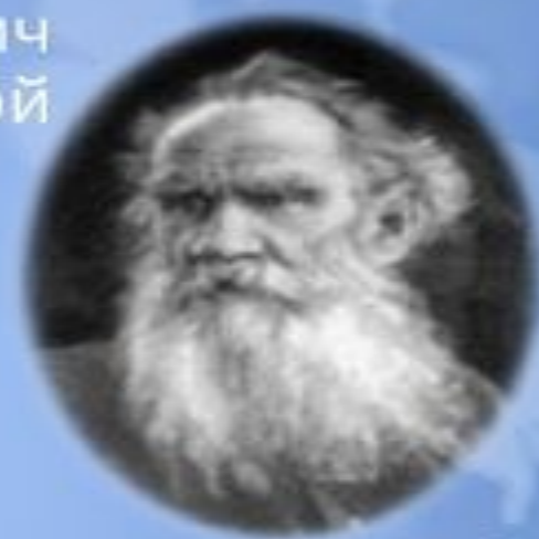
Константин Андреевич Тон