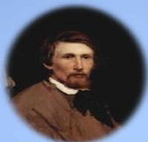
Виктор Михайлович Васнецов