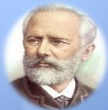
Пётр Ильич Чайковский