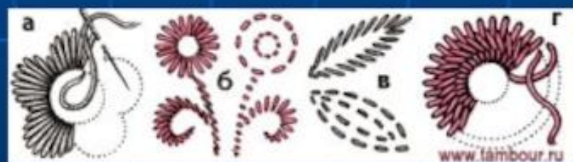
Верхошов: а-в - варианты шва, г - гладь «восьмерка»