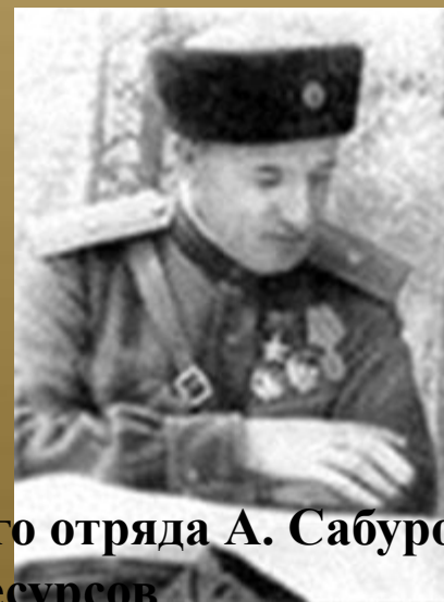
Командир партизанского отряда А. Сабуров

Участвовал в боевых действиях с японцами на озере Хасан. В начале Великой Отечественной войны, с июля по сентябрь 1941 года, был шофером при особом отделе 3-й армии на Брянском фронте. Попал в окружение. Пробираясь к линии фронта в лесах Сумской области, встретился с партизанами Ямпольского отряда партизанского соединения бывшего чекиста Александра Сабурова и остался в отряде. Сначала был бойцом, а со временем стал командиром группы автоматчиков.