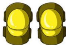
НАКОЛЕННИКИ И НАЛОКОТНИКИ