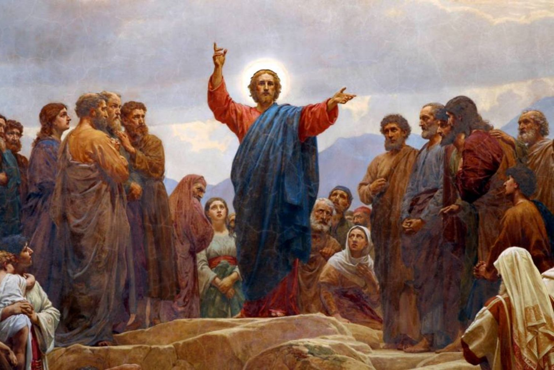
Генрик Олрик. «Нагорная проповедь»