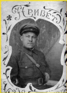
Привет из хварабовска