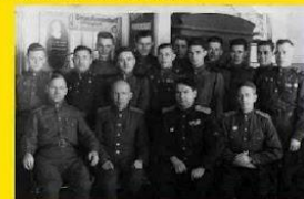
23.02.1947 Тверская обл г. Вышний Волочек