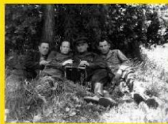
Фронтные друзья-и конец сороковых