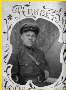
Привет из хиваровска