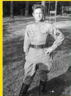
03.08.1945 Чехословакия г Водорла