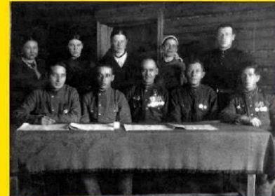
Политработа с колхозниками