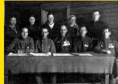
Политработа с колхозниками