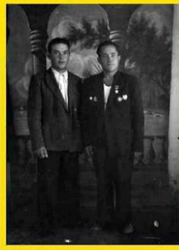
1954 год г. Наминган