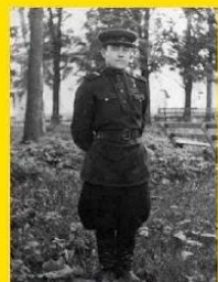
Август 1946 год Тверская обл г. Вышний Волочек