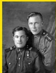
Тверская обл г. Вышний Волочек 09.1946