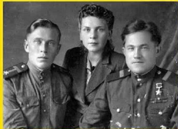
1946 год август Тверская обл г. Вышний Волочек