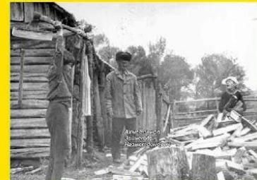
Команда тимуровцев у героя