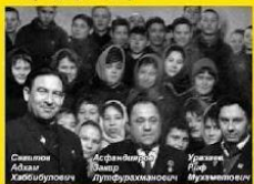
встреча в ЯШЛИ селишменте года