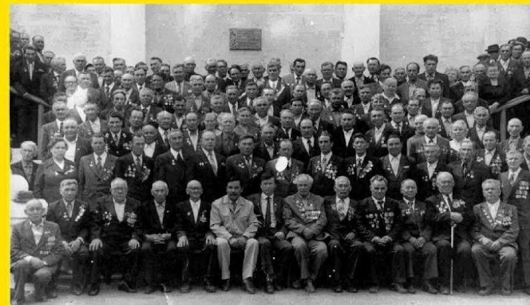
Встреча ветеранов Гафурийского района