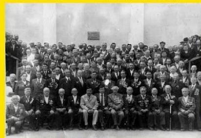
Встреча ветеранов Гафурийского района