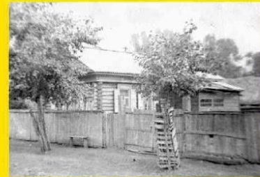
Родной дом Ахметзянова З.Н. Ахметзянова 5