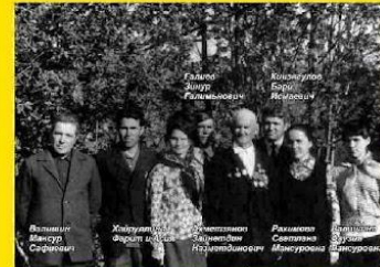
09.05.1973 Встреча с работниками ЯСШ