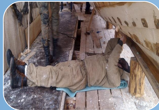
Обслуживающий персонал (местные жители)