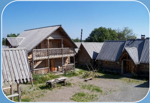
Гостиничный комплекс (в аренде);