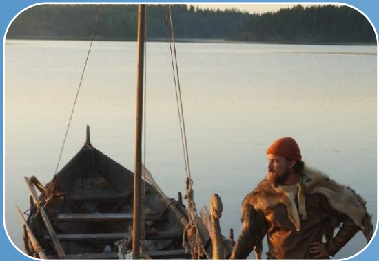
Капитаны и помощники капитанов на водные суда