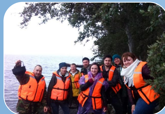
Снаряжение, предназначенное для соблюдения техники безопасности