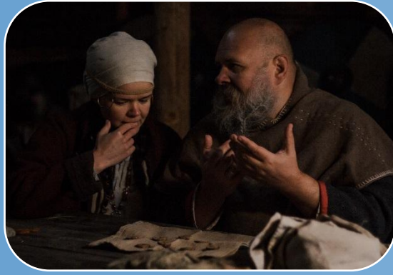
Туристы и отдыхающие на территории острова по программе без похода