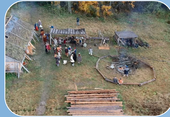
Поселение семьи рыбаков «Длинный дом + хоз. постройки» (одноэтажное строение 6x12м)