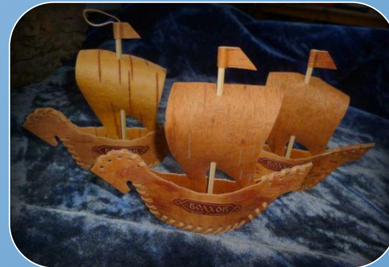
Планируется сотрудничество с местными производителями