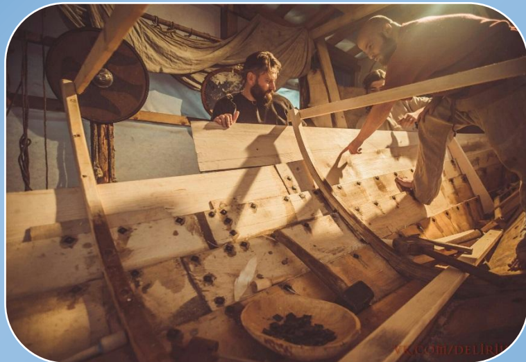
Верфь деревянного судостроения