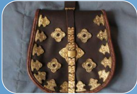
Продажи товаров мастерских