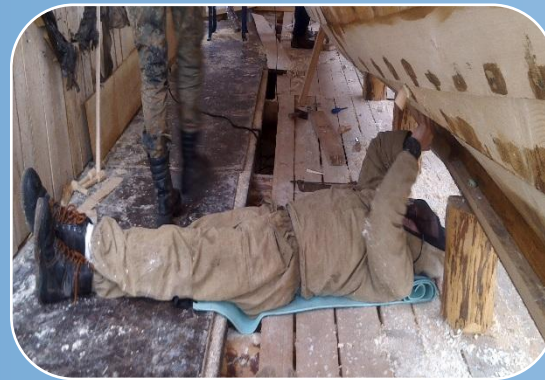
Обслуживающий персонал (местные жители)