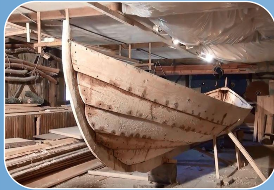
Производство деревянных судов на заказ