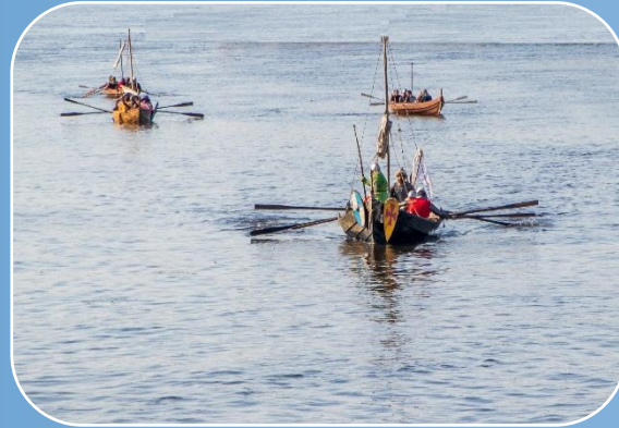
Реплики судов 9го века (лады периода создания древнерусского государства) вместимостью 12 и 15 человек;