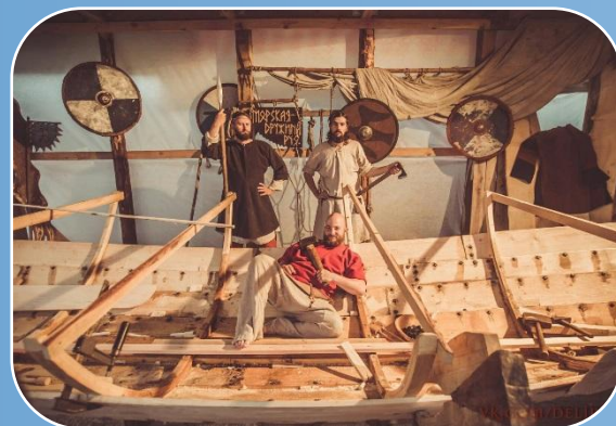
Верфь деревянного судостроения