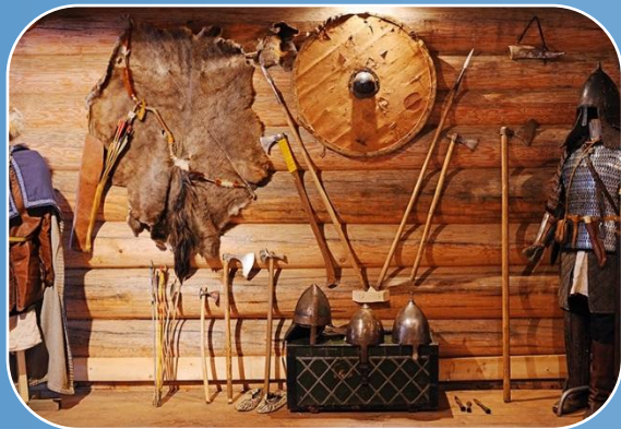
Предметы быта, одежда, инструменты, вооружение соответствующей эпохи