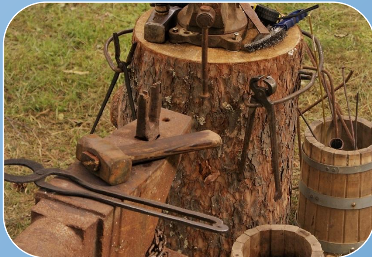
Мастерские ремесел, кузня, кожевенная мастерская для производства товаров быта, вооружения, товаров на продажу и сувенирной продукции