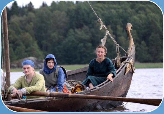
Походно-туристические группы по различным программам