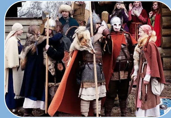
Проведение мероприятий под заказчика