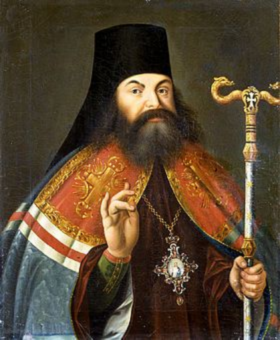
Преосвященный Феофан Прокопович