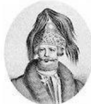
Мстислав Великий (1125-1132)