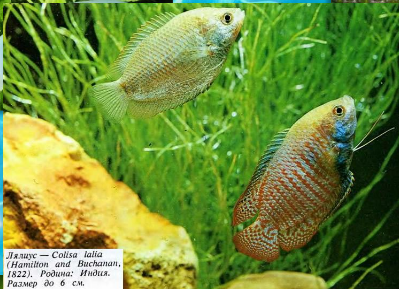
Лялиус — Colisa lalia (Hamilton and Buchanan, 1822). Родина: Индия. Размер до 6 см.