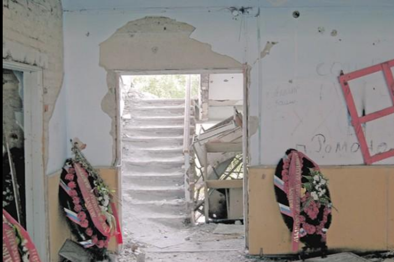
Венки в полуразрушенном здании на месте гибели сотрудников Центра специального назначения ФСБ России.