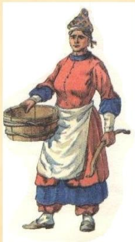
Нижнедонская казачка в повседневном костюме. XVII век.

Одевались зажиточные казачки красиво и богато. Они носили турецкие, татарские, черкесские одежды, русские сарафаны. У них были дорогие, иногда серебряные пояса. Зимой носили длинные шубы. Головы девушек украшали повязки с медными позолоченными гвоздиками и бахромой. В косы вплетали яркие ленты. Замужние казачки носили «кички» (шапкообразный головной убор. На лоб одевали вышитую подвязку с подвесками, нитки с жемчугом или бисером. На шее носили «ожерельники» из монет и монисты. Руки украшали браслетами, обувались в красные сапожки на каблуках