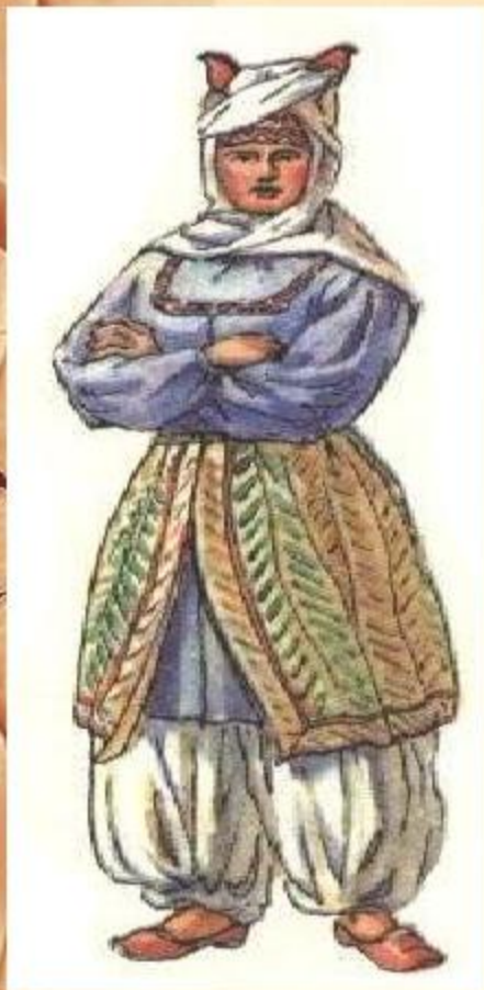
Верхнедонская казачка в XVII веке.