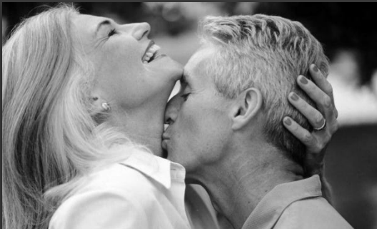
3. Влюблённые друзья