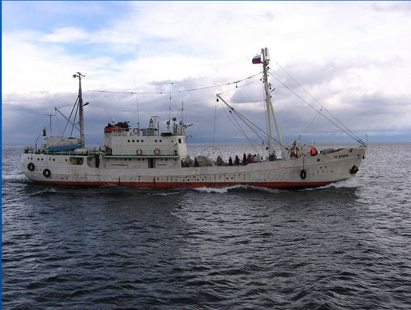
Научно-исследовательское судно «Верещагин»