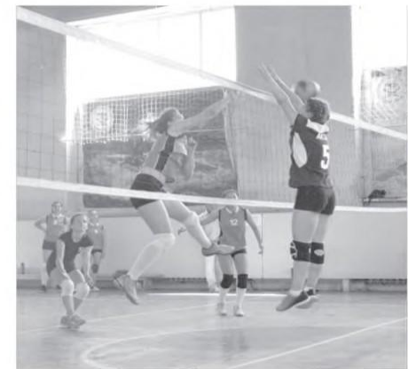
Горячий момент: мощный бросок Дианы Белкановой не был отражен поставленным блоком

26 июня на стадионе «Спартак» прошло торжественное открытие Олимпиады обучающихся Республики Алтай