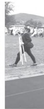
Огонь олимпиады в

На стадионе 26 июня торжественно открылась XVI Малая летняя Олимпиада обучающихся Республики Алтай.