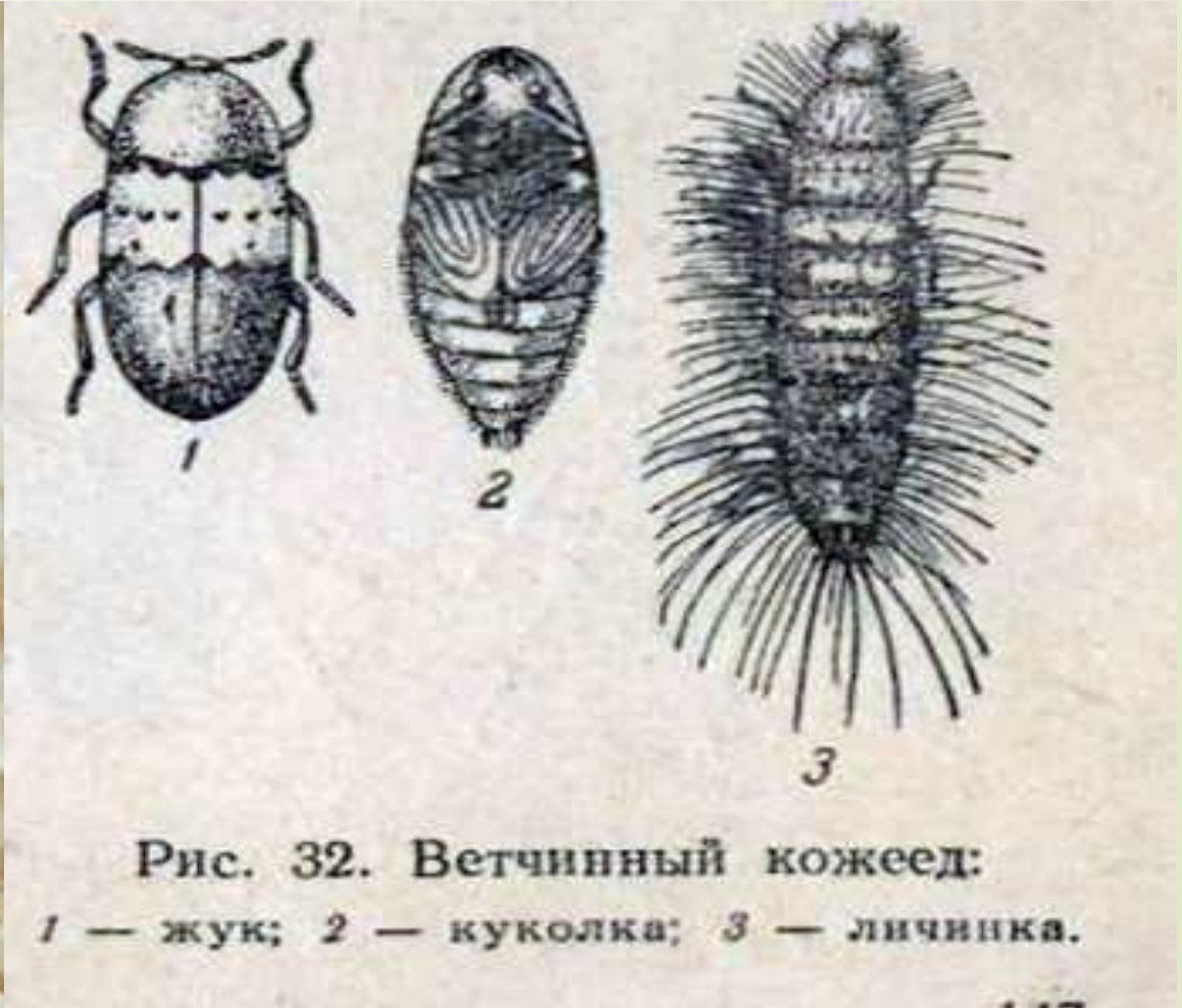
Рис. 32. Ветчинный кожеед: 1 — жук; 2 — куколка; 3 — личинка.