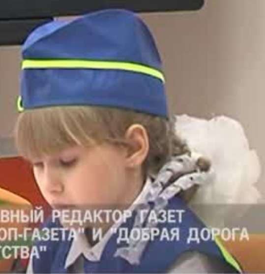
ГЛАВНЫЙ РЕДАКТОР ГАЗЕТ "СТОП-ГАЗЕТА" И "ДОБРАЯ ДОРОГА ДЕТСТВА"