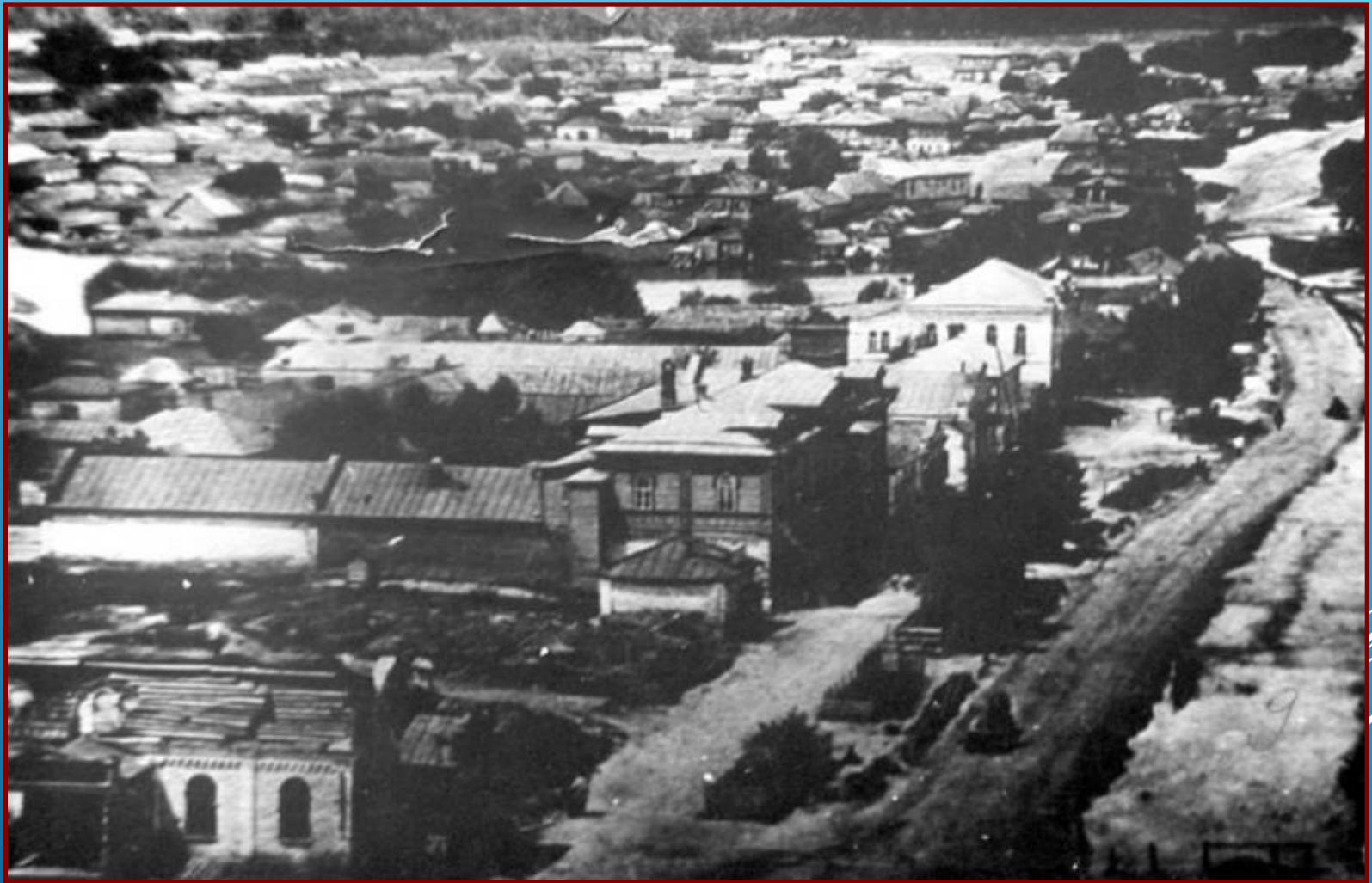
Улица Миллионная (сегодня ул. Пушкина)