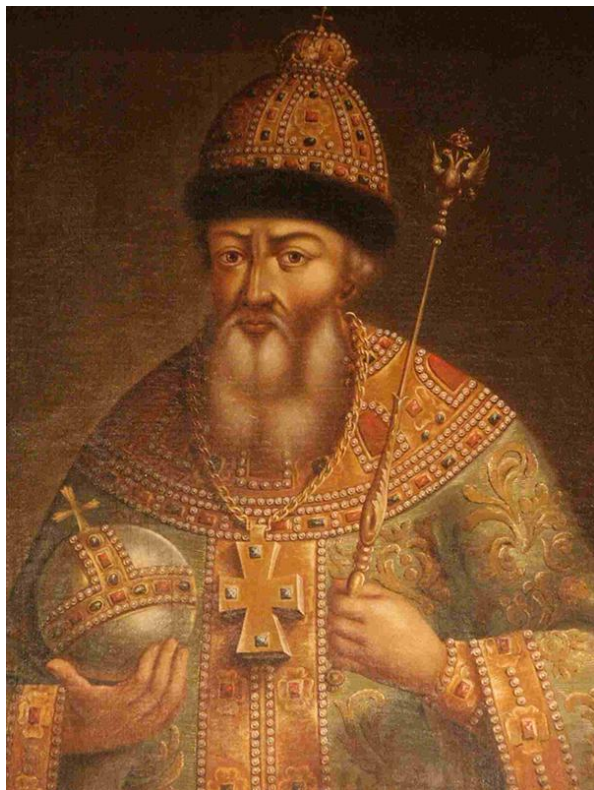
Василий Шуйский (1606 - 1610)