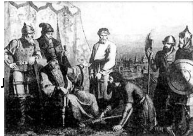
И. И. Болотников является с повинной перед царём Василием Шуйским. Неизвестный художник