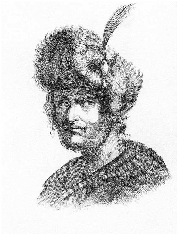
Лжедмитрий II Предполагаемый портрет