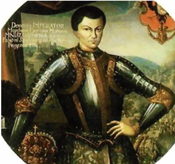
Лжедмитрий I (1605 - 1606)