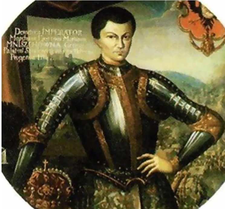
Лжедмитрий I (1605 - 1606)

1604 г. – Лжедмитрий со своим войском перешел российскую границу.