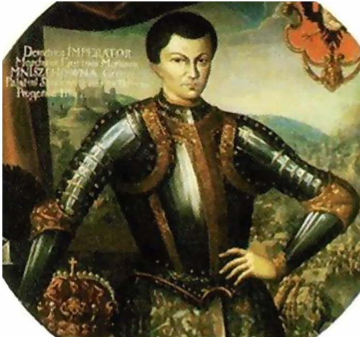
Лжедмитрий I (1605 - 1606)