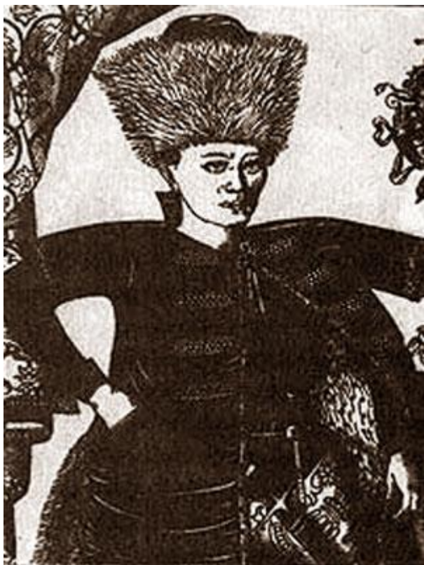
Лжедмитрий I Гравюра XVII в.