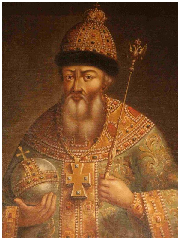
Василий Шуйский (1606 - 1610)