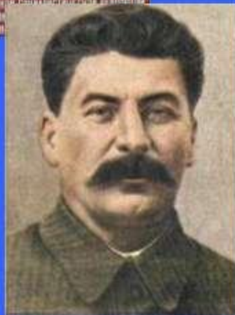
Сталин Иосиф Виссарионович 1879 - 1953