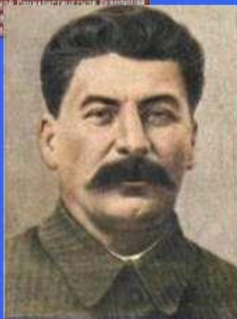
Сталин Иосиф Виссарионович 1879 - 1953