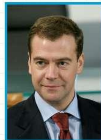
Д.А. Медведев с 7 мая 2008 г. действующий