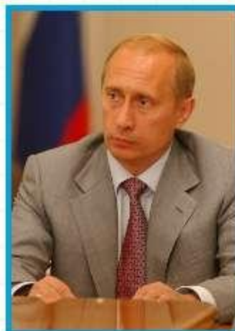
В.В. Путин И.о. с 31 декабря 1999 по 7 мая 2000 с 7 мая 2000 г. по 7 мая 2008 г.