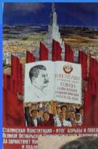
Сталинская Конституция - это борьба и победа Великой Октябрьской Социалистической революции. Да зарастает поле и поляна!