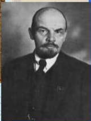
Ленин Владимир Ильич 1870 - 1924