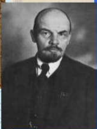
Ленин Владимир Ильич 1870 - 1924