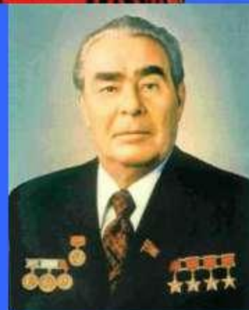
Брежнев Леонид Ильич 1906- 1982