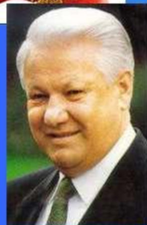
Ельцин Борис Николаевич 1931 -2007