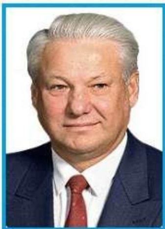
Б.Н. Ельцин с 10 июля 1991 г. по 31 декабря 1999 г.