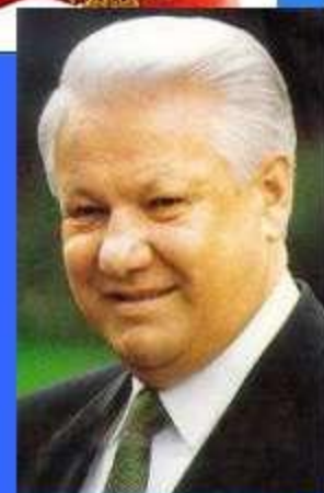
Ельцин Борис Николаевич 1931 -2007