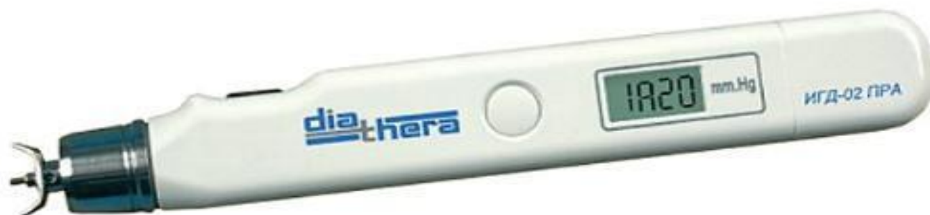
Офтальмотонометр ИГД-02 diathera . Прибор измерения внутриглазного давления