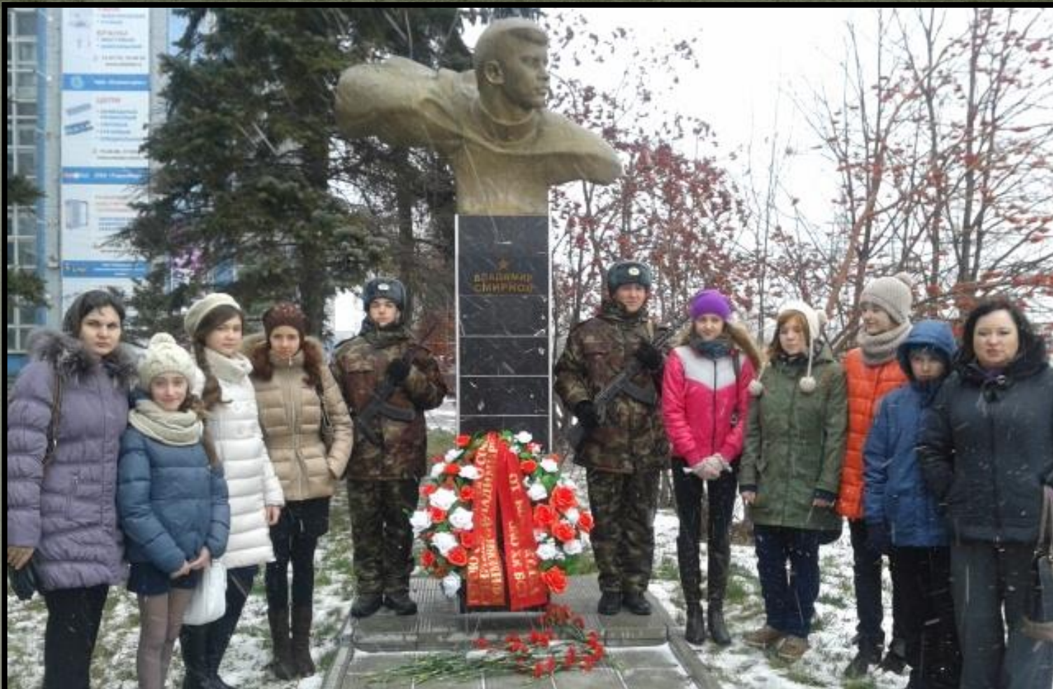
Ученики и учителя гимназии № 27 у памятника В.Е. Смирнову на территории Барнаульского станкостроительного завода. 2013 год