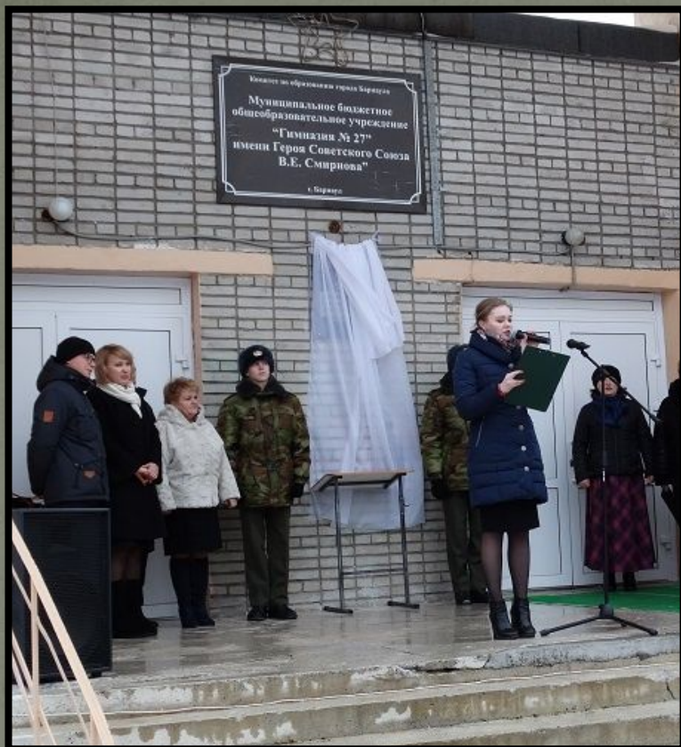
Открытие мемориальной доски в честь Героя Советского Союза В.Е. Смирнова на фасаде гимназии № 27. 2017 год