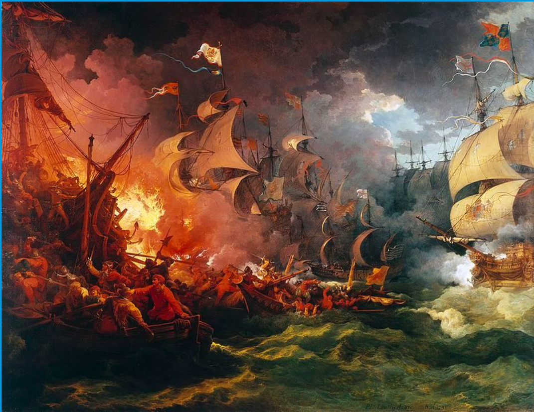
Худ. Ф. Лютербург. Разгром Непобедимой армады 8 августа 1588 г.