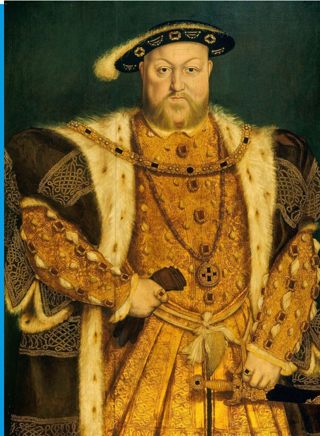
Генрих VII Тюдор

1534 г. – издание закона, объявлявшего короля главой английской церкви